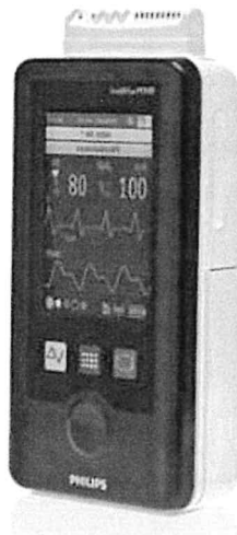
圖 1 – MX40 裝置

本 現場安全通知 旨在提醒客戶查看 Intellivue MX40 使用說明書 (IFU) 的資訊，瞭解如何使用待機模式，並說明在什麼情況下使用或接觸裝置可能造成傷害。本通知提醒使用者使用待機模式的相關風險，以及降低或消除風險應採取的步驟。