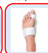
拇趾外翻夜間支架