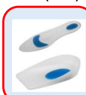
全足矽膠墊 足後跟矽膠墊