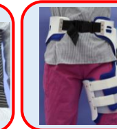
髕關節外展支架 (可調整式)