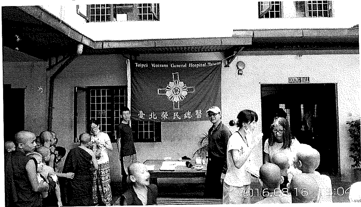
Figure 3 醫療團隊提供加德滿都 Jamchen Gompa 佛學院院童醫療協助與諮詢