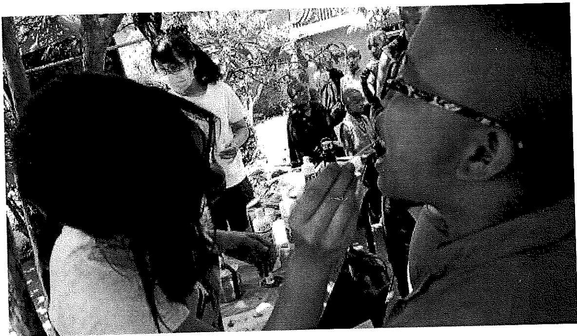
Figure 7 醫學生協助為女尼牙齒塗氟