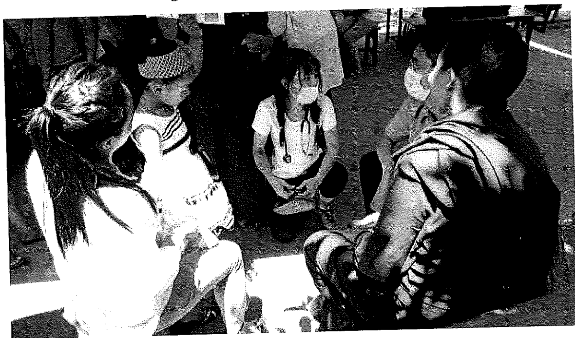
Figure 5 醫療人員共同討論病患之狀況