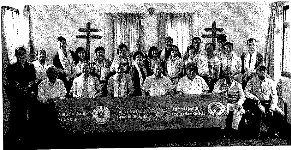
Figure 2 我方醫療團隊與尼泊爾防癆協會執行合作計畫