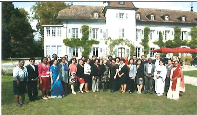
圖三 GNLI 結訓合照