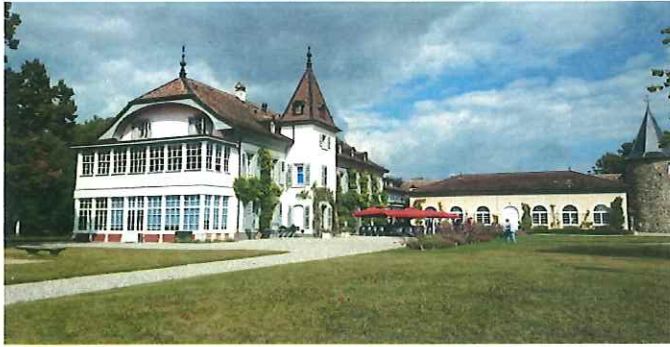
圖一 Château de Bossey 外觀