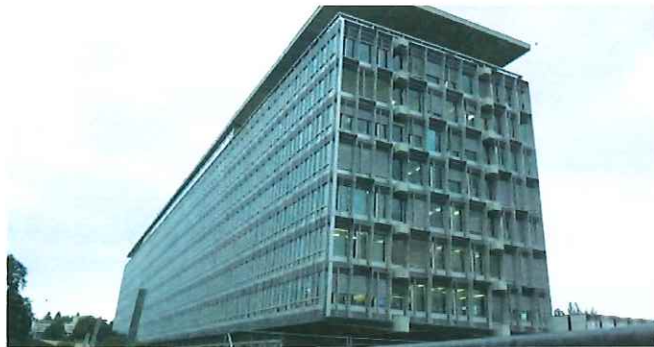
圖五 WHO 大樓外觀