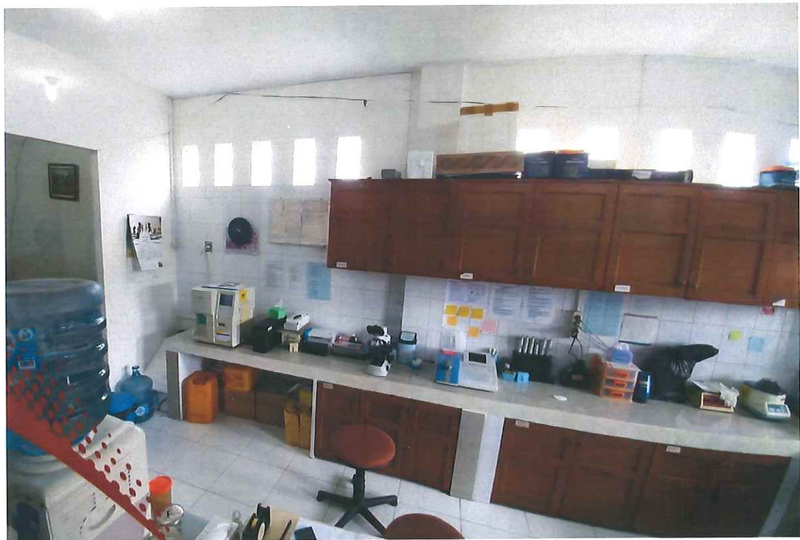
圖 4、連鎖社區藥局 Kimia Farma Apotek 的臨時調配(compounding)區