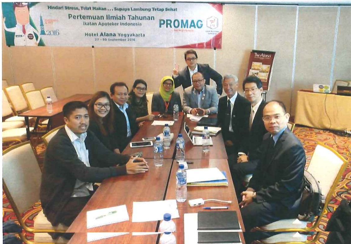
圖 9、我方代表與印尼藥學會及印尼衛生部藥師共同研商如何落實優良藥事作業，並草擬何作協定。