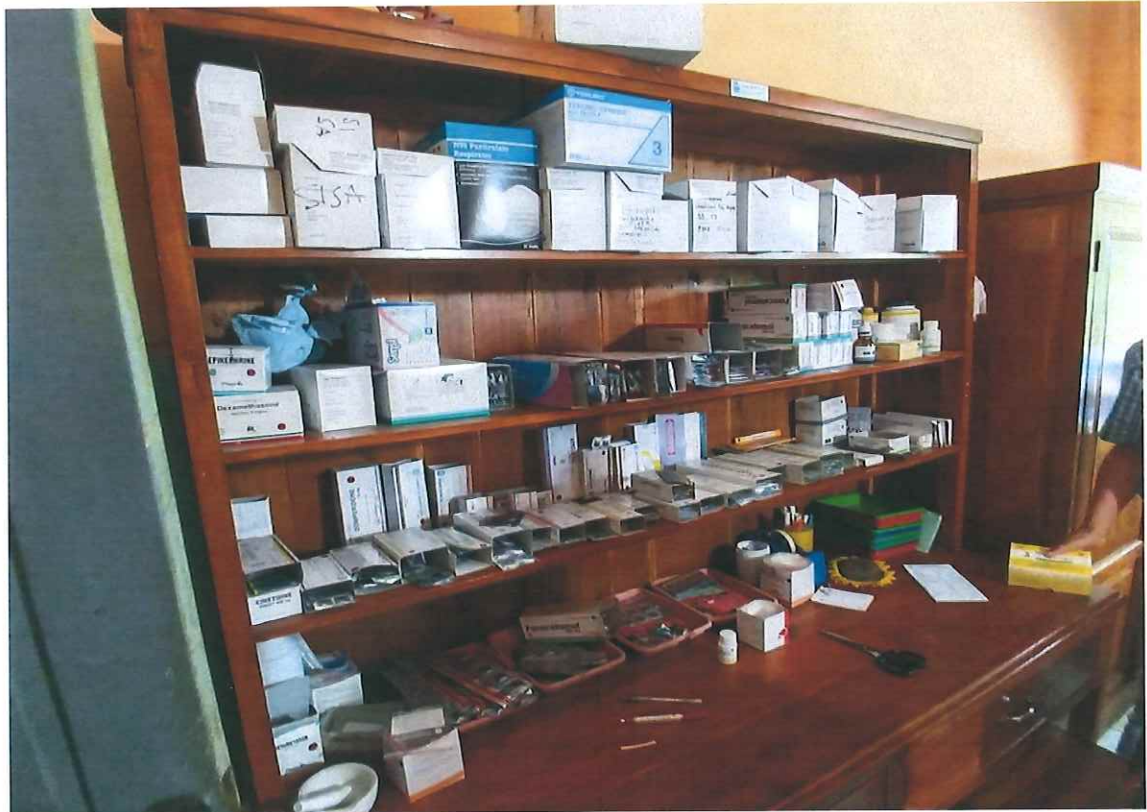
圖 6、日惹郊區的衛生中心 Puskesmas 藥品調劑櫃檯