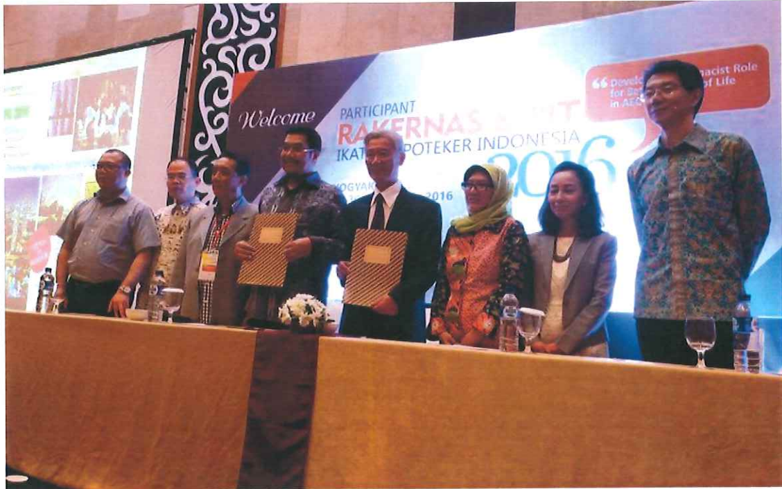
圖 13、印尼藥師會大會閉幕式前舉行正式與亞洲藥學基金會簽訂合作備忘錄 (Memorandum of Understanding)，為印我雙方的藥事服務合作計畫，建立劃時代的里程碑。