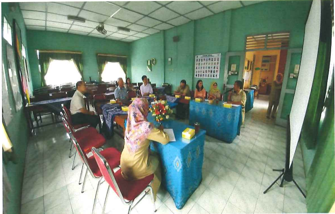
圖 5、參訪日惹郊區的衛生中心 Puskesmas，聽取負責藥師簡報