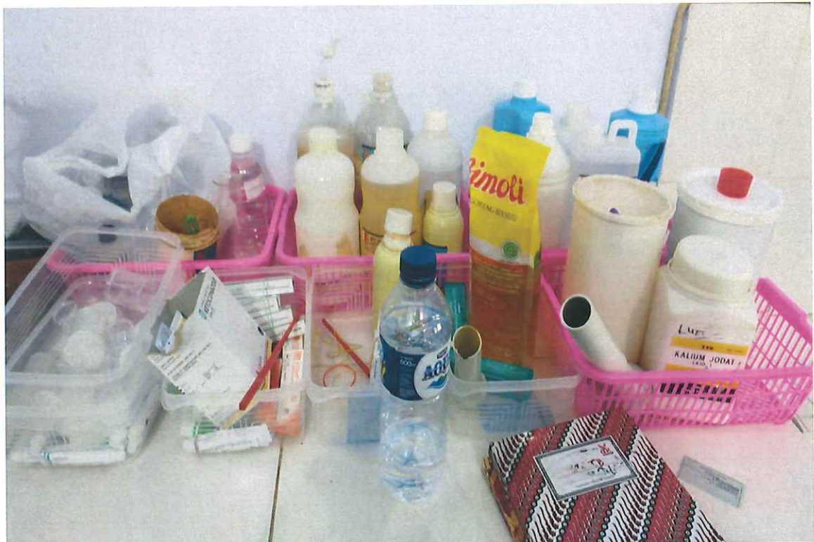
圖 8、參訪地區醫院 Wonosari Hospital，臨時調配環境簡陋、調劑檯面零亂、藥品標示亦不夠完整清楚，皆有許多需要改進加強之處