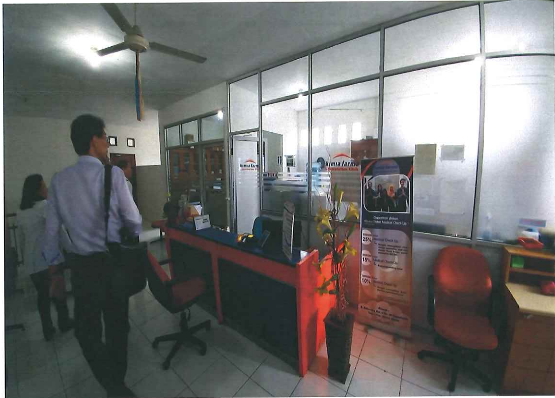
圖 3、連鎖社區藥局 Kimia Farma Apotek 的附設檢驗室及收費櫃檯