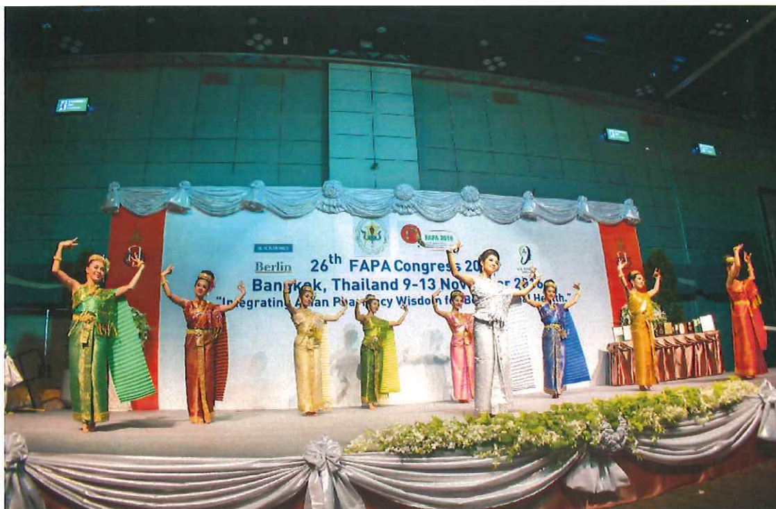
圖 2、2016 亞洲藥學會年會開幕式