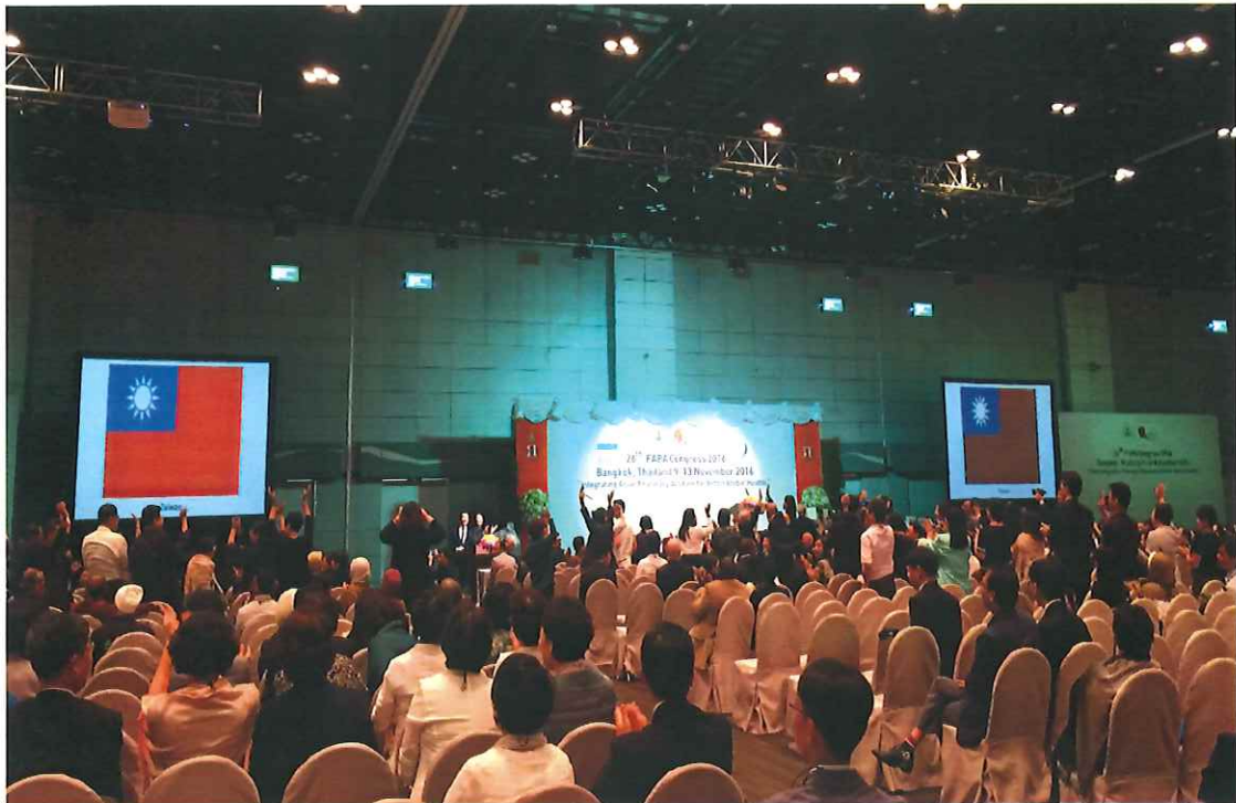
圖 3、2016 亞洲藥學會年會開幕式：會員國介紹