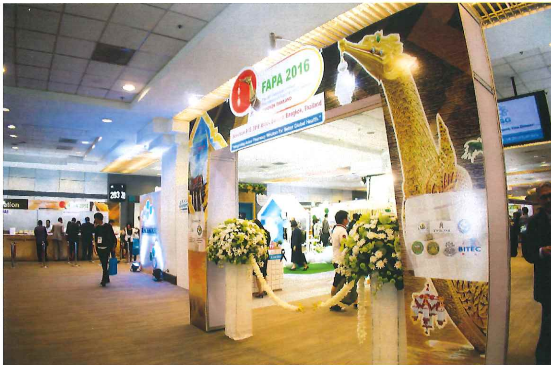
圖 1、2016 亞洲藥學會年會會場