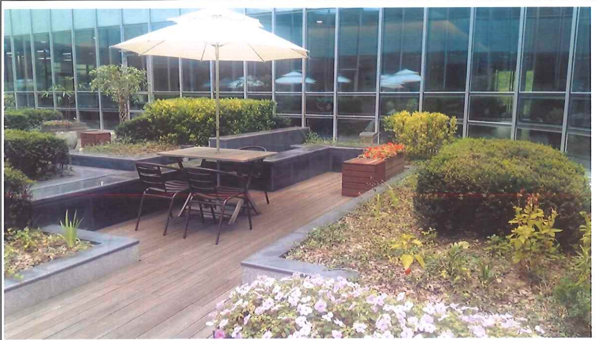
長照醫院 Gangnam-gu Haengbok Convalescence Hospital