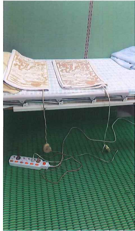
老人福利中心 Seongbuk Senior Welfare Center