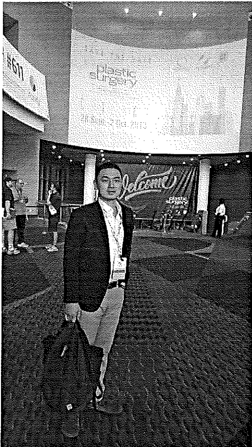
( 2017-The Meeting 於美國奧蘭多橘郡會議中心會場 )