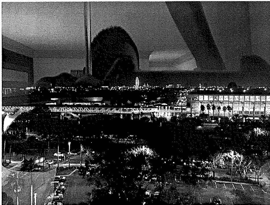
(奧蘭多。橘郡會議中心夜景)

蘭多！這座去年我來過的城市，今年我又重新踏上了這裡。當然，相同的場景但是時間人物和目的的不同就會給人不一樣的觸動。去年一心想到迪士尼去玩，從下了飛機，機場就有安排好的 Express 送你直達 Disney Resort 裡面去，也不用轉車也不用什麼思考要吃些什麼，跟著人群走就是了。今年不同了，開會的地點在奧蘭多市區內，距離 Disney 有相當的一段距離，加上其實奧蘭多的交通沒有想像中的方便。當地沒有車，其實要使用他們的大眾運輸系統是滿不方便的。然而就在幾經波折之後我們也到達我們的飯店：Rosen Centre Hotel。隔日一早，正當我們還在絞盡腦汁用不流利的英文找到去會場的路，沒想到到達的目的地其實就在眼前，一個透過旅館房間的窗戶就可以看得到全貌的地點：Orlando Orange Convention Center 橘郡會議中心。