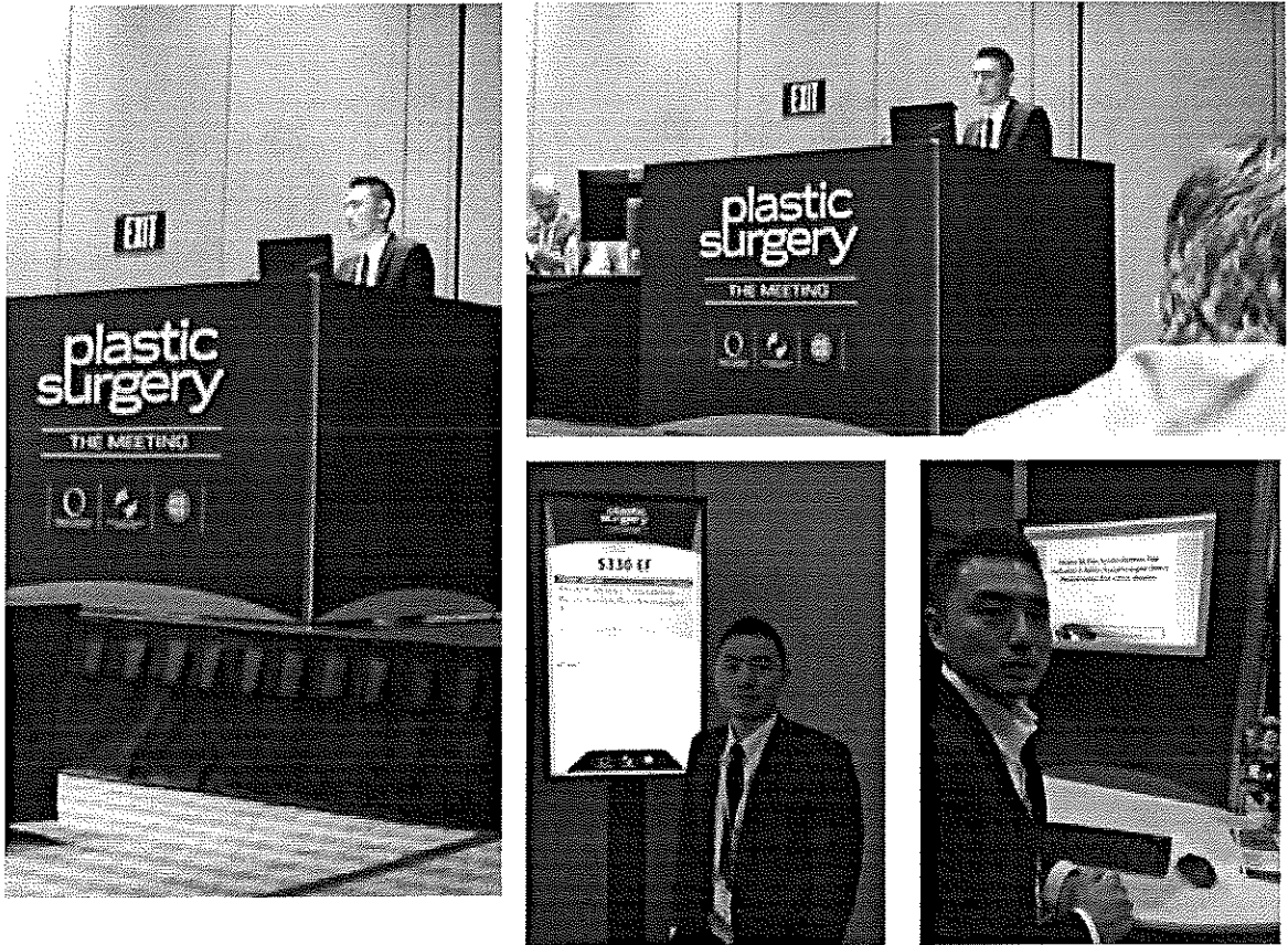
(於會中口頭及海報發表本院整型外科於去年顯微重建手術之臨床研究的結果)