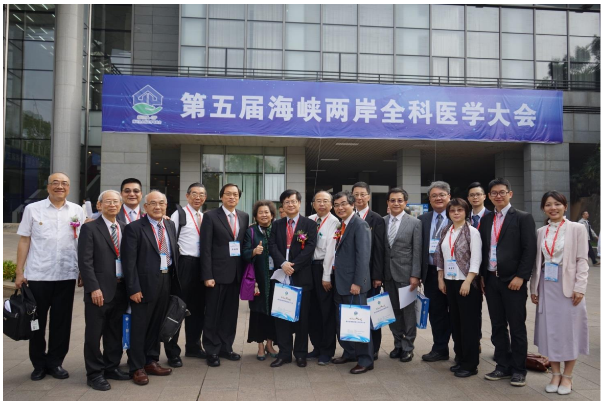
「第五屆海峽兩岸全科醫學大會」台灣代表團員合影