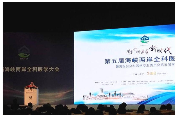
大會開幕式主持人致詞