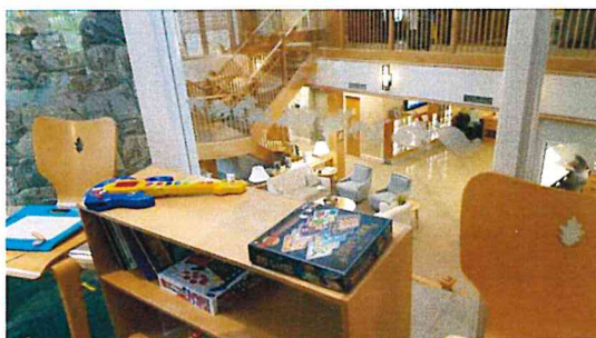
圖三 NIH Childrens' Inn 遊戲區