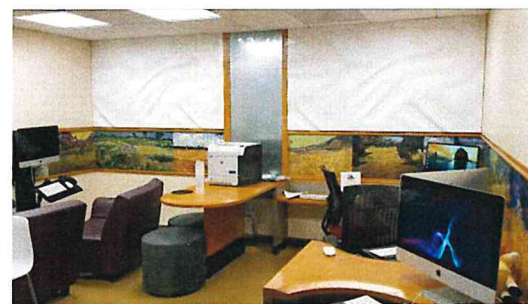
圖三 NIH Childrens' Inn 學習區