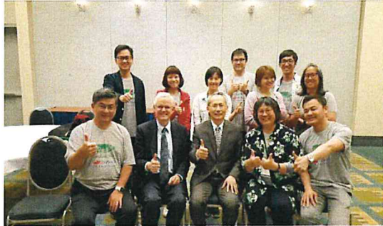
圖十二 與 InterAction CEO 晤談