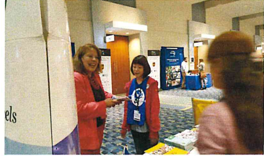
圖十 吸引國外友人關注攤位