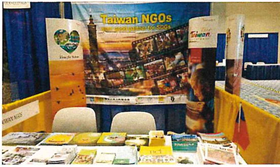
圖七 我國的參展攤位