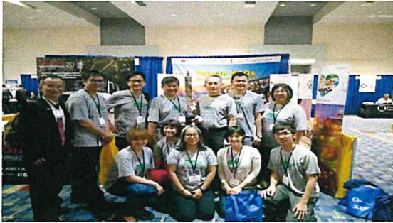
圖九 整齊劃一的環保材質團服