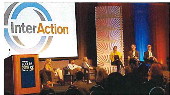
圖六 志工援助計畫模擬審查

臺灣 NGO 的攤位展示也是此次代表團的活動重點之一。攤位展示是向與會成員介紹臺灣的好機會，為我國爭取國際的能見度與發聲機會。攤位展示內容豐富多元，展現了臺灣 NGO 的活力(圖七、圖八)，也成功吸引許多外國友人前往攤位關注交流(圖九)。代表團成員穿著以 6 個寶特瓶再生製成的團服，除了展示我國對環境保護議題的關注與成就，也象徵我國 NGO 代表的凝聚力與行動力(圖十)。我代表團也成功結識了美國、日本、加拿大的國家志工聯盟的主席重要人士(圖十一)，另外也在團長的努力運作之下，邀約到 InterAction 的 CEO 與代表團進行私人晤談，把我國 NGO 未來參與 InterAction 年會，甚至在年會上發表演說的機會化為可能(圖十二)。