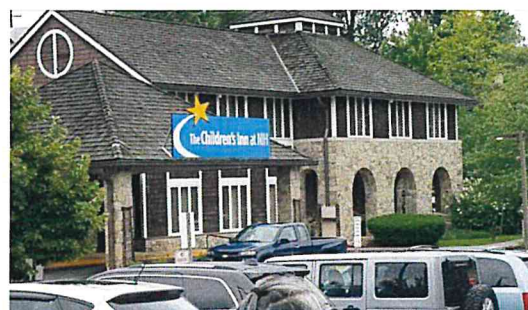
圖二 NIH Childrens' Inn