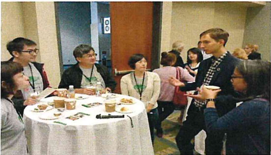
圖十一 結交加拿大 NGO 組織主席