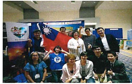
圖八 代表團員合影