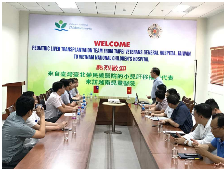
圖 4. 越南河內國家兒童醫院副院長致辭歡迎