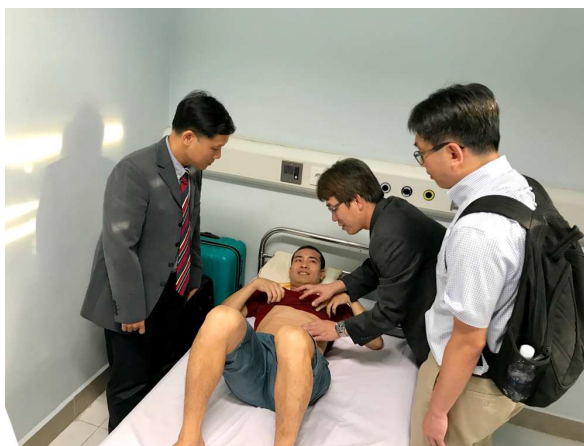
圖 9. 團隊探視第一例之捐贈者(病童的叔叔)