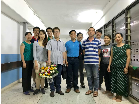
圖 23. 北榮兒童移植團隊手術後與第一例家屬合影