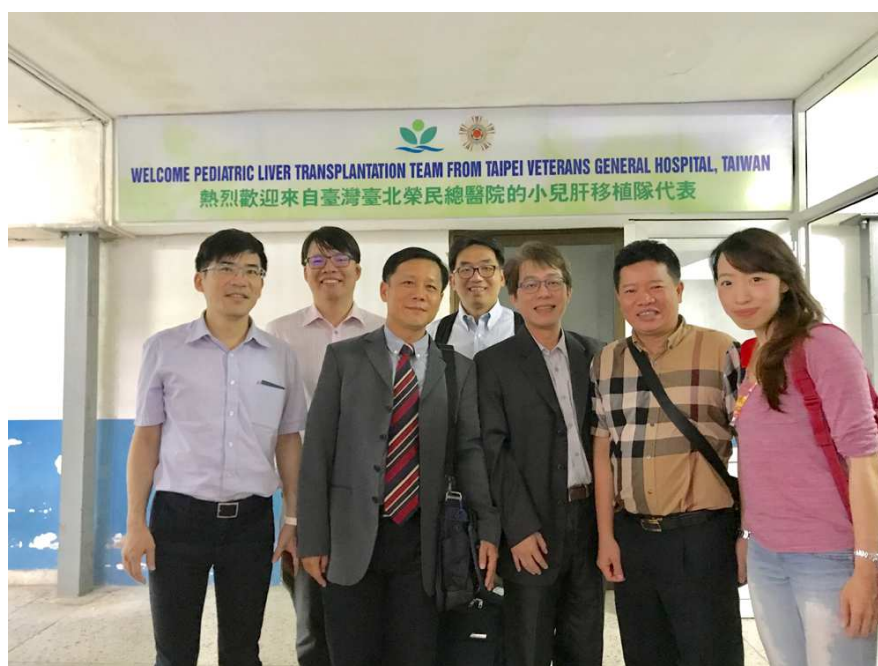
圖 2. 越南河內國家兒童醫院外科部部長(右 2)迎接北榮兒童移植團隊