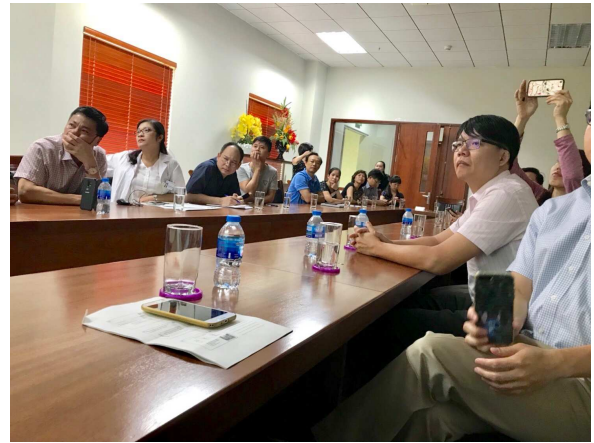
圖 6. 雙方進行術前討論會議