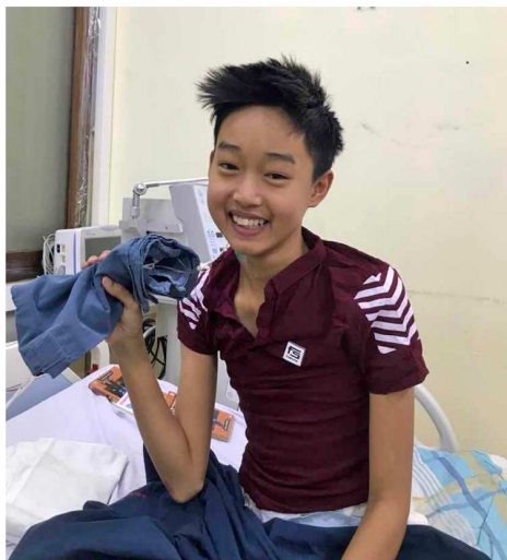
圖 31. 第一例病童術後第 7 天在病房很有活力地打招呼