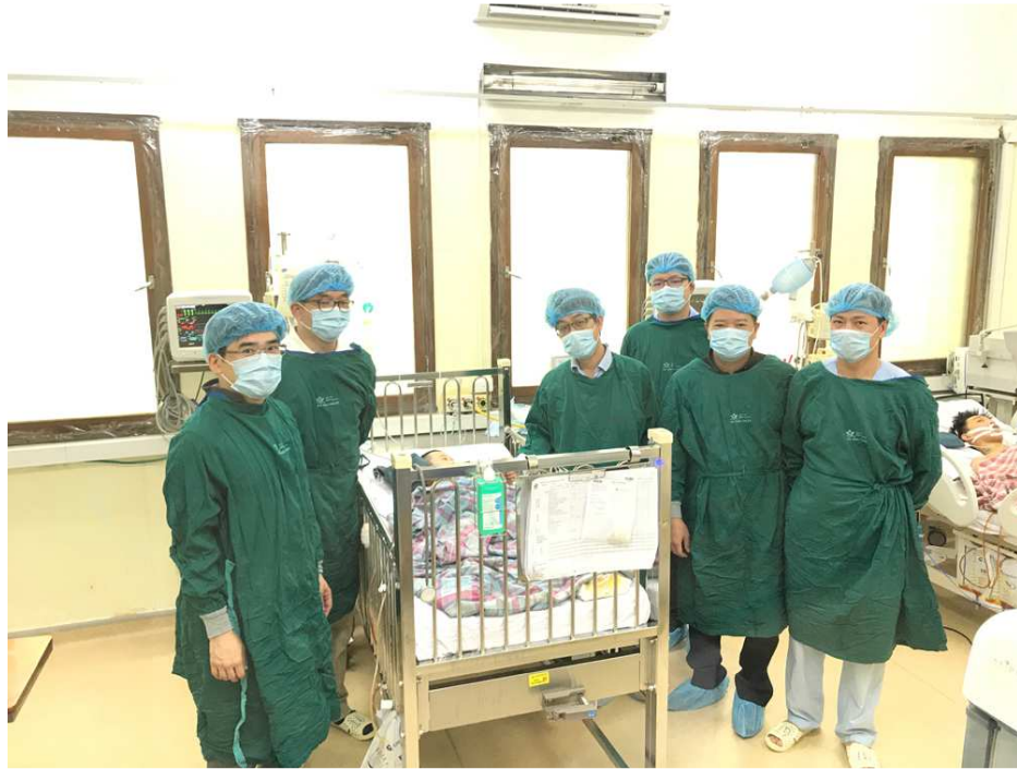
圖 26. 北榮兒童肝移植團隊與越南團隊在第二例病患肝手術後第一天在加護病房與病童