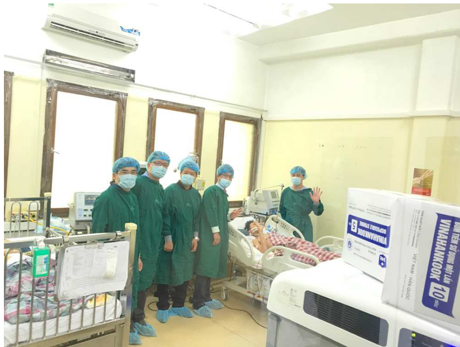
圖 25. 北榮兒童肝移植團隊與越南團隊在第一例病患肝手術後第三天在加護病房，病童舉手表示 OK