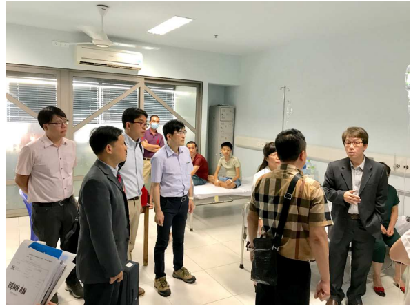
圖 12. 團隊與該院之內、外科醫師討論