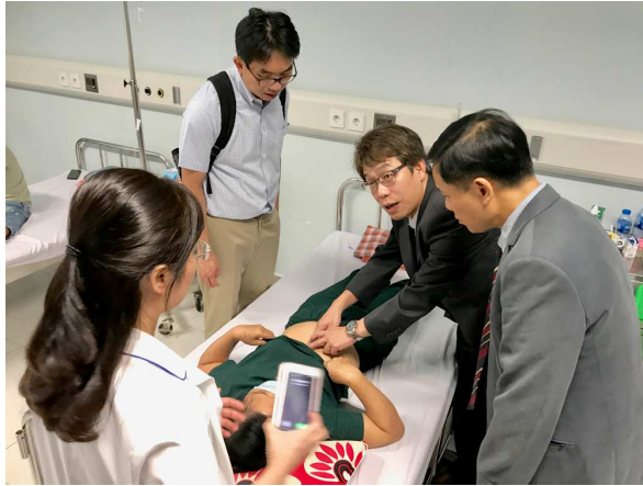
圖 11. 團隊探視第二例之捐贈者(病童的外婆)