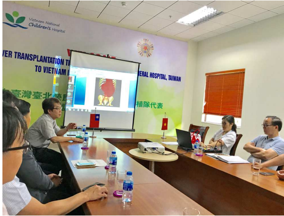
圖 5. 雙方進行術前討論會議