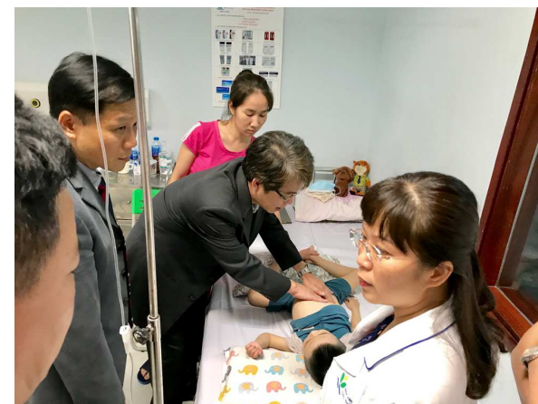
圖 10. 團隊探視第二例病童