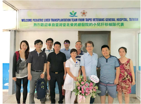
圖 24. 北榮兒童移植團隊手術後與第二例家屬合影