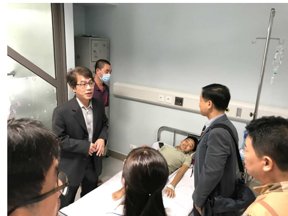
圖 8. 團隊探視第一例病童