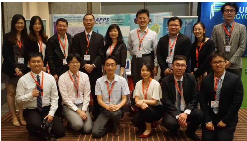
(圖示：部分台灣代表於攤位前之合影)

下午三點至六點報到時間，領取整個大會的手冊及相關資料，Poster 報告人員開始張貼 poster，與世界各國的兒童胸腔專家初次會面。六點進行 Opening ceremony，本屆大會主席為 Giovanni Rossi 及 Masato Takase，兩位簡短致詞，接著為美國學者 Bruce Rubin 帶來的 special lecture: Macrolides: from diffuse pan-bronchiolitis to CF and beyond. Opening ceremony 結束後有雞尾酒會。台灣代表團晚上特別小聚，讓不同醫院的兒童胸腔科醫師有機會在日本交流、認識。