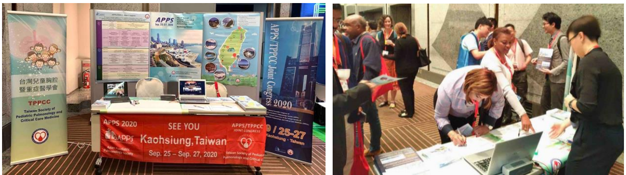
(圖示：此次台灣各醫院共同組成的學術團，共同佈置了宣傳攤位，宣傳明年於台灣舉辦的亞洲兒胸大會，各國學者報名踴躍)

此次世界兒童胸腔大會舉辦的地點位於日本千葉，對於我們來說算是相當接近的國家，整體的基礎建設也很完善，從下飛機到開會會場也有直達的巴士可以搭乘，是個方便好到達的開會地點，整體的會議流程也很順暢，從報到，海報的張貼，以及每個 session 入場前刷 barcode 等等，雖然兒胸大會的人數並不多，但還是可以感受到國際會議與國內會議的差異，這也是我們需要學習的地方。