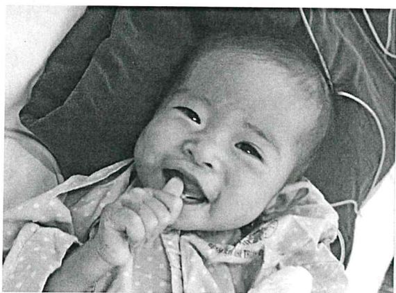
圖 9. 病童手指比讚開心微笑