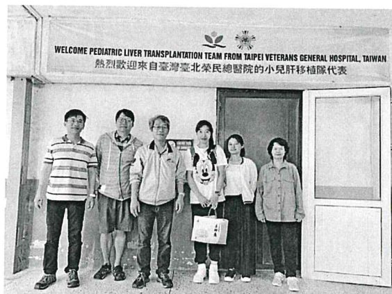
圖 10. 回台前一天本院團隊於病房外與本院的歡迎布條合影