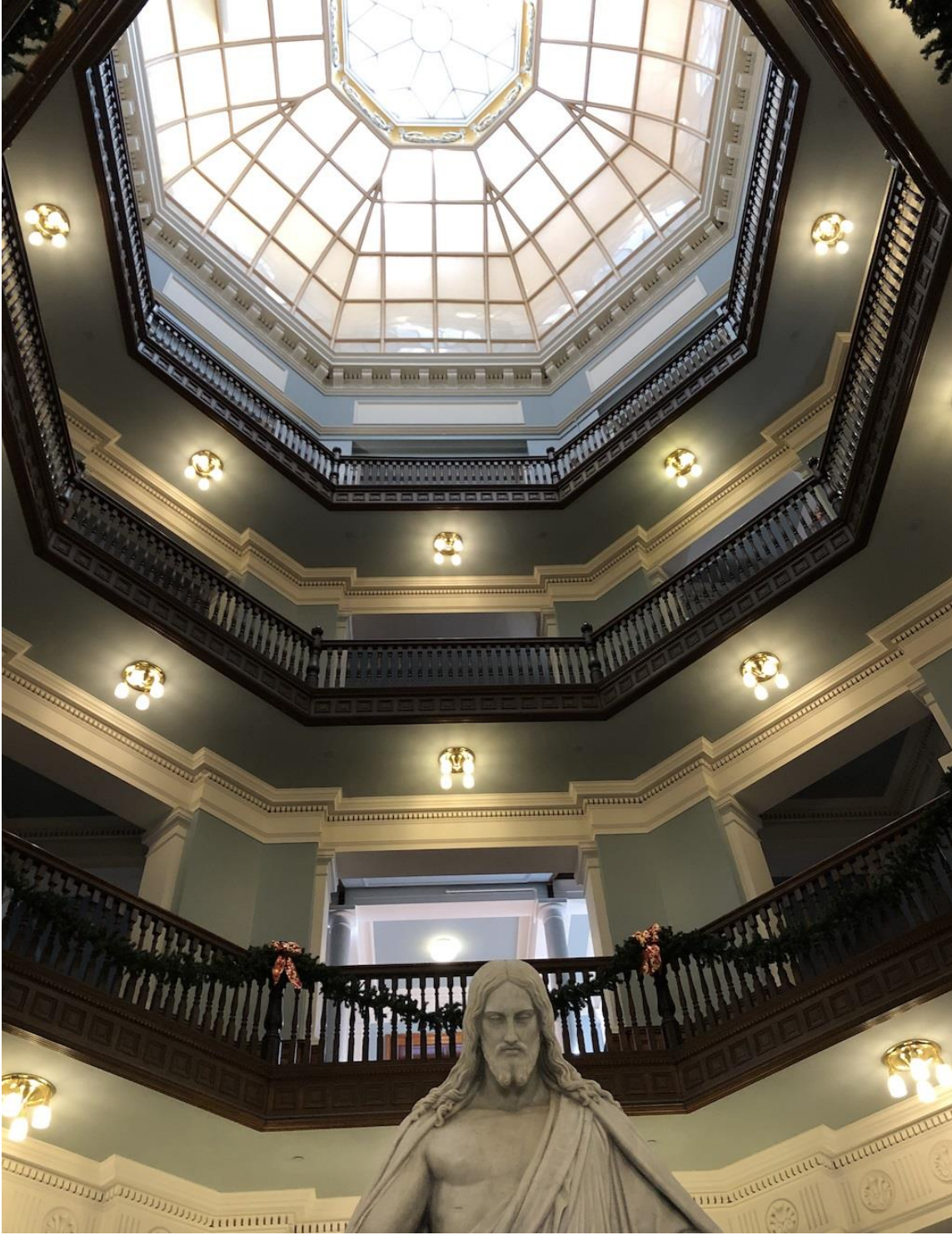
醫學上 grand round 的發源地！