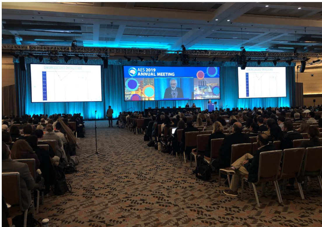
開會人數眾多，議場很大。