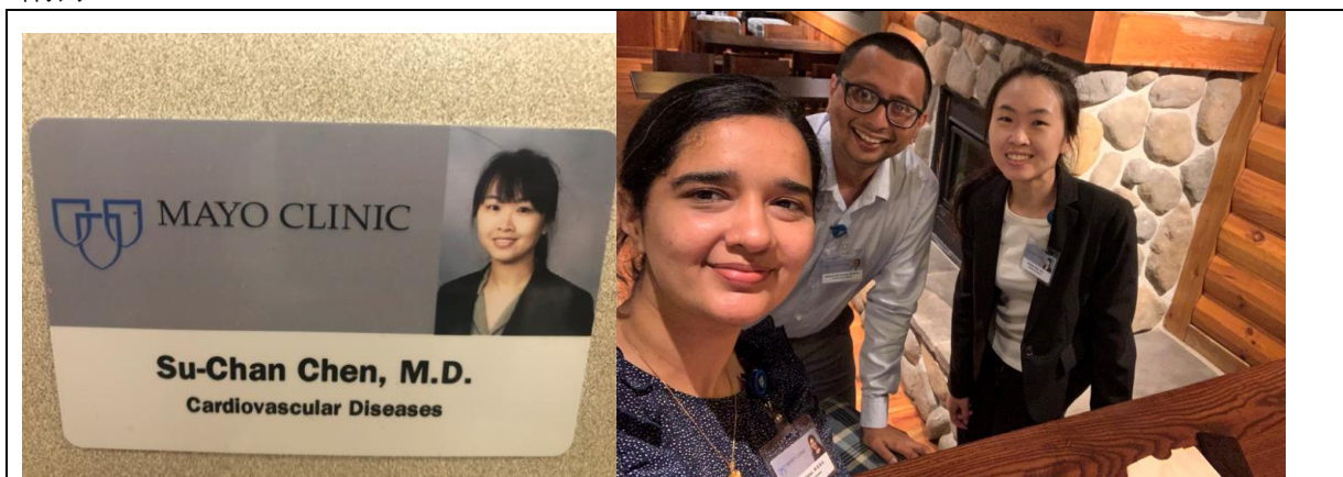
醫院生活、醫院同事合照