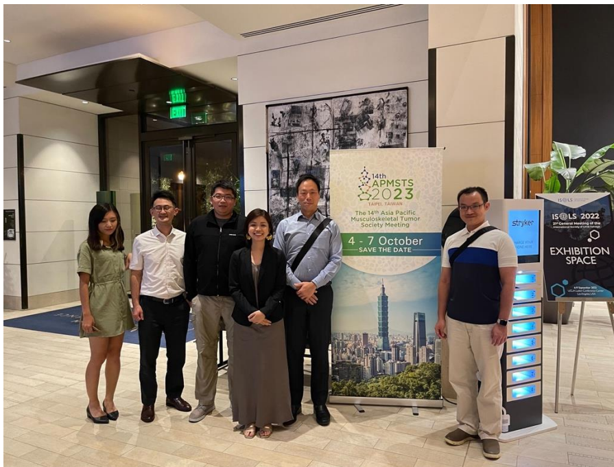
會議主辦方也提供空間給我們宣傳明年的亞太骨腫瘤醫學會雙年會