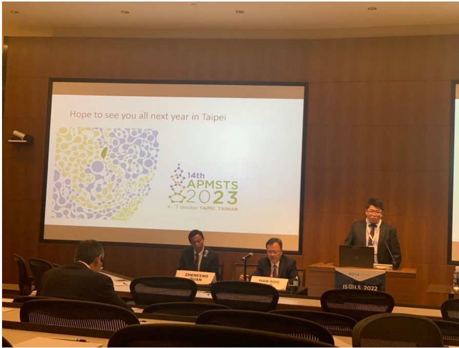
利用演講空檔宣傳明年的亞太骨腫瘤醫學會雙年會