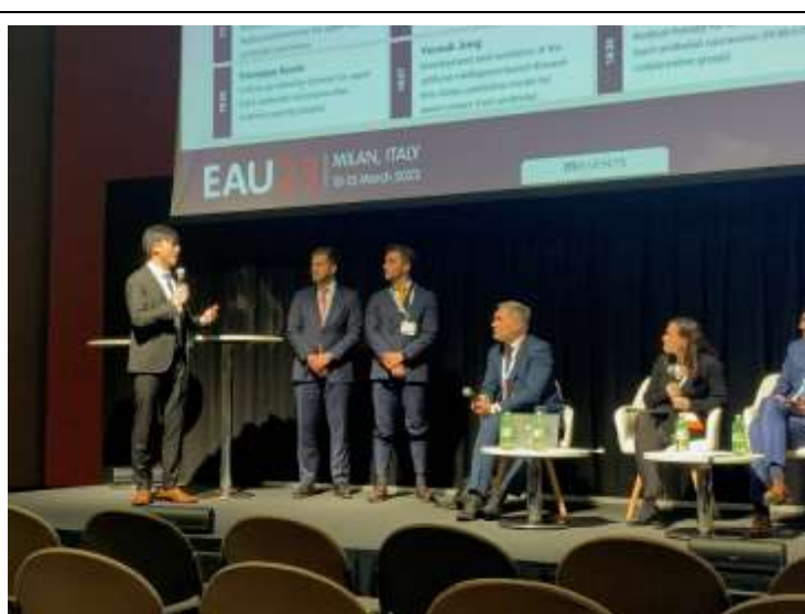
Figure 3-2 Discussion