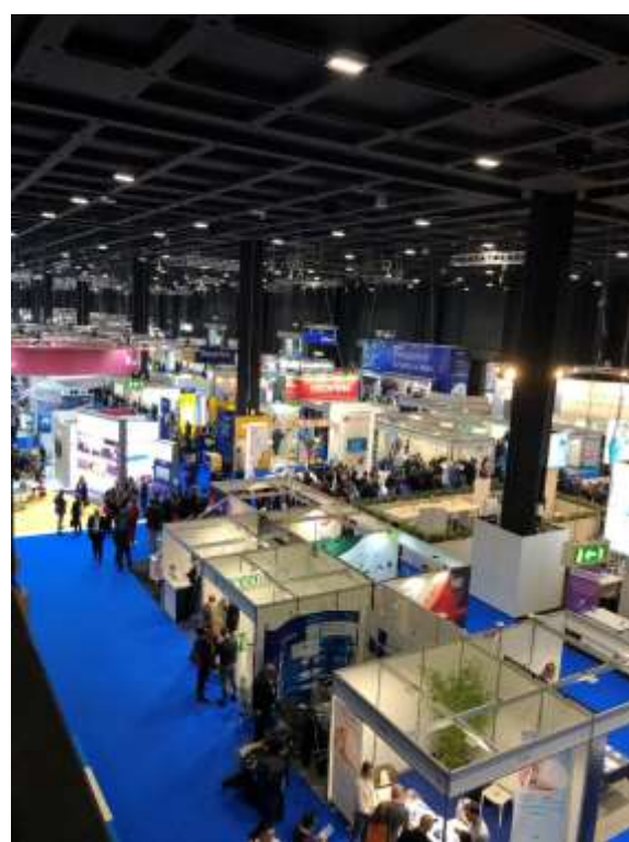
Figure 1-2 一望無際的廠商展場

EAU 不愧是資源最豐富的組織之一，其針對 EAU23 年會有專屬的手機 app 建構，供與會者下載使用。其中除了議程查詢，可針對有興趣的 session 座勾選，建立屬於自己的 agenda。其更可便利地查詢到所有與會者的資訊、其擔任座長的場次、報告的專題等。基本上所有有關年會的所有資訊，都可在 app 中成功獲取，著實便利。