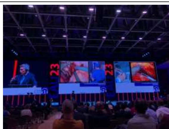
Figure 2-2 Live Surgery