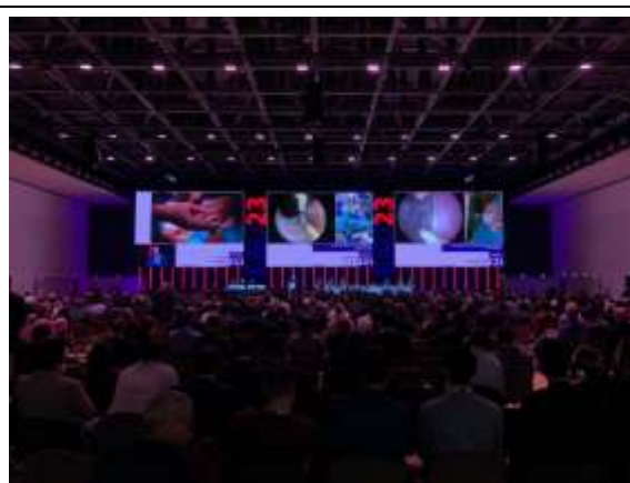
Figure 2-1 Live Surgery

會期第二天的 surgery live demo 是整場會期裡最令我驚豔的部分。可容納超過千人的講堂裡，以三個大螢幕同時分別實況轉播不同的手術，與會者會領到一台收音耳機，可自己選取頻道，選擇要收聽的 live surgery 語音，因此雖然多個手術同時進行但彼此之間並無干擾，一天下來將近 30 台的 live surgery 呈現精彩絕倫。其所受邀呈現的手術皆是最尖端之技術呈現，或是當今公認最具代表性的大師展示其開刀手法。看著 live surgery 的流程表時自己心想，某些手術通常都是需耗時數小時才有辦法完成，大會怎麼只安排一小時的時間，這樣真的開得完嗎?然而大師真的就能在一小時內從容不迫地完成手術，並同時透過麥克風與現場觀眾分享箇中細節，著實令人嘆為觀止，一整天下來實為收穫滿滿的影音饗宴。