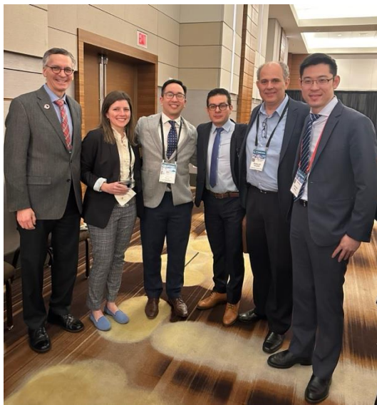
與匹茲堡的老師及同時期的研究員合影