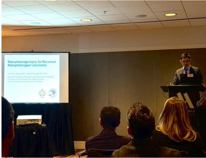
我於第二日的演講