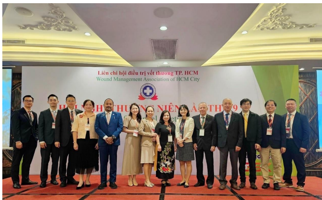
圖二 2024.06.15 胡志明市傷口照護學會主辦單位和臺灣參訪團及各國學者合影。

本次會議也聆聽國際學者分享治療患者的經驗，本次會議共有四大部分，分別為困難傷口的治療、感染的糖尿病傷口及複雜傷口、感染傷口的基本治療、重建及其他主題等，並學習到對於傷口的多方面治療。