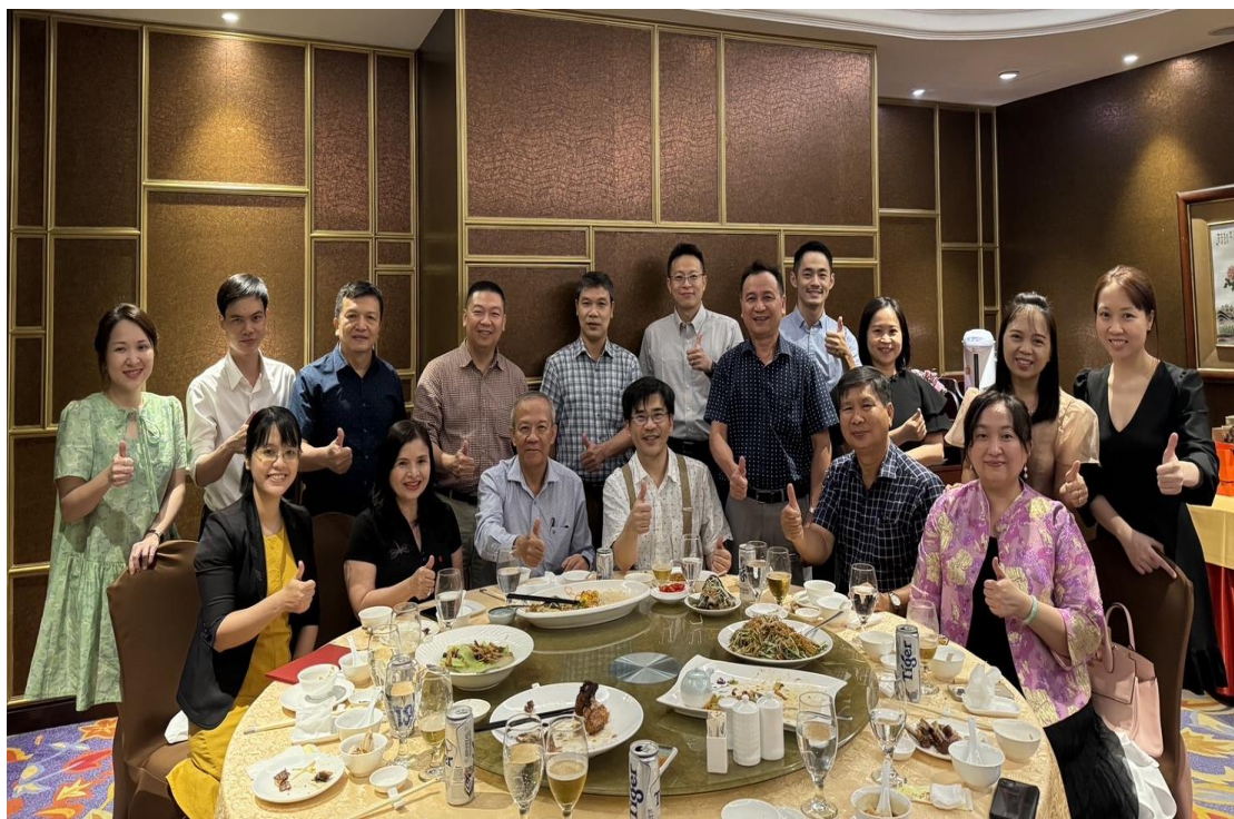
圖六臺北榮總團隊與胡志明醫藥大學醫院及大水鑊醫院整形外科團隊餐敘合影