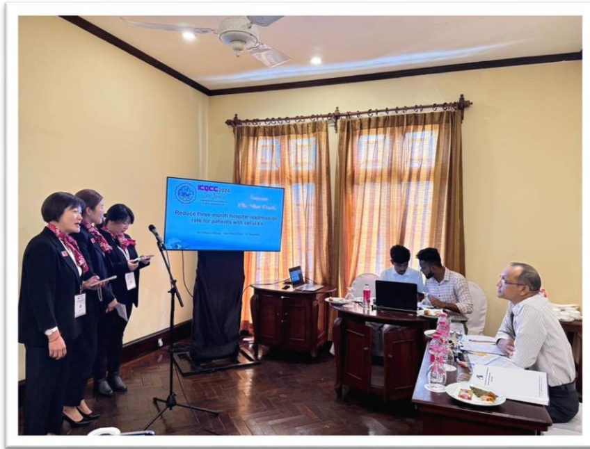
齊心圈團員於會場發表