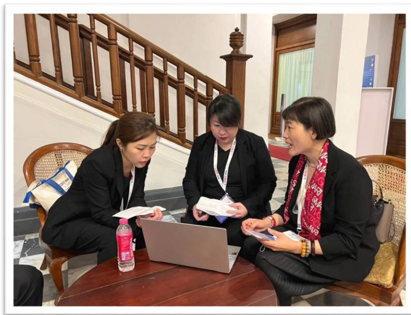
齊心圈團員於會場演練