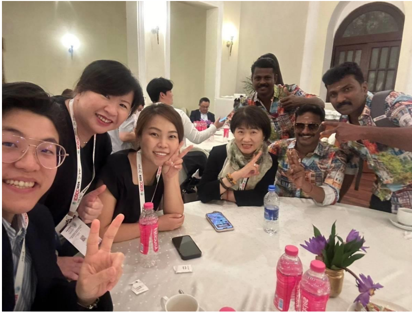
團員與印度品管圈員合影