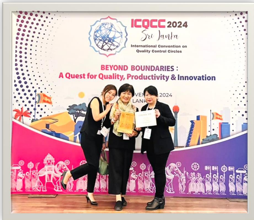
齊心圈榮獲金獎『Gold Award』殊榮