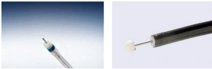
圖三、Dual knife (左) 的 dissection 比較 sharp 但是也容易切得過深，IT nano (右) 由於前端是鈍端所以在黏膜較薄處相對安全，兩者各有其優缺點

但縮短了 procedure time 與提升了手術的安全性，經過這次學習後，未來我會更仔細地在術前跟病患分析討論各種器械的優缺點及費用，讓病患能在經濟許可的範圍內去選擇最適合的治療方式。