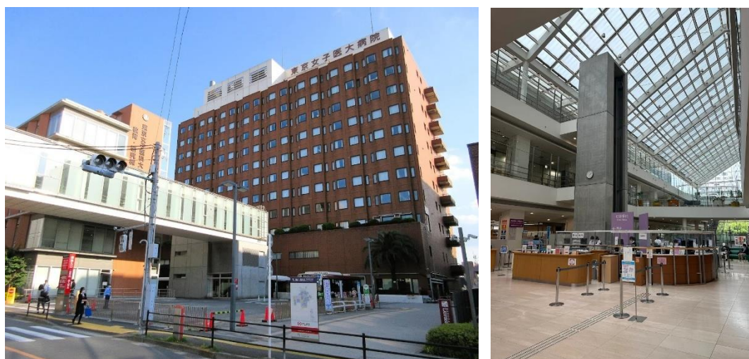
圖一、東京女子醫科大學附屬醫院外觀(左)與大廳(右)，大廳非常整潔明亮

這次主要是至日本東京女子醫科大學附屬醫院(圖一)進行兩周 (2025/11/30-2025/12/13) 的進階內視鏡黏膜下切除術研習，該醫院的內視鏡病患種類多元，治療性內視鏡包含息肉切除術 (polypectomy)、內視鏡黏膜切除術(Endoscopic mucosal resection, EMR)、內視鏡黏膜下切除術 (Endoscopic Submucosal Dissection, ESD)及使用結紮器 (ligating device) 的內視鏡黏膜切除術(Endoscopic mucosal resection with a ligating device, EMRL)等，東京女子醫科大學的病患主要來自於其他院所或診所診斷的早期胃腸道腫瘤病患為主，主要病例為早期食道癌、早期胃癌、大腸側方擴散性腫瘤，一周約有 10-15 個 cases，在該院研習過程中野中教授非常仔細地介紹各部位腫瘤切除所需要注意的細節，並且在最後一天安排 hand-on workshop 讓我們實地操作離體豬食道與胃部模型，讓我們能更加具體地了解如何安全地切除病灶，兩周學習下來收穫滿滿，對於病灶的評估與處理有更詳盡的認識與學習。