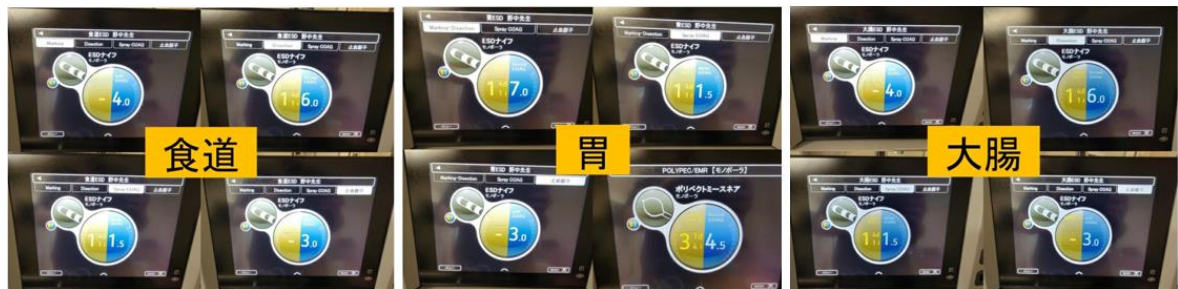
圖二、電燒機的設定根據不同部位的病灶有所差異

在 submucosal injection 部分，野中教授非常強調 indigo carmine 的顏色深度需要足夠深才能凸顯出 Submucosal layer 跟 muscle layer 的差別，該院的做法是把 20ml 的玻尿酸(商品名為 MucoUp，是專門使用在 Submucosal injection 的特殊玻尿酸)添加 0.3ml indigo carmine 及 0.1ml epinephrine，這部分是本院 ESD 準備時比較忽視的部分，雖然台灣沒有 MucoUp 這種特製的內視鏡注射用玻尿酸，但是仍可參考野中教授的建議將之運用在 glycerol+indigo carmine 的調製上。