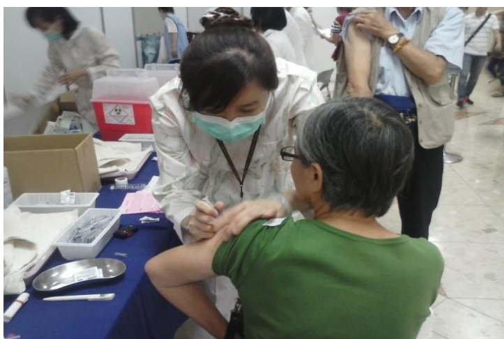
民眾接受疫苗注射實況

六、配合政府醫療衛生政策，本院辦理成人流感暨肺炎疫苗接種，自 10 月 1 日至 7 日在中正 1 樓大廳施打。流感疫苗接種對象：50 歲以上、罕見疾病及重大傷病者。肺炎疫苗接種對象：75 歲以上長者及未接種過肺炎鏈球菌疫苗者。本院人力支援總計 266 人次。流感疫苗施打數量計 6700 針，肺炎疫苗 116 針。（醫療）