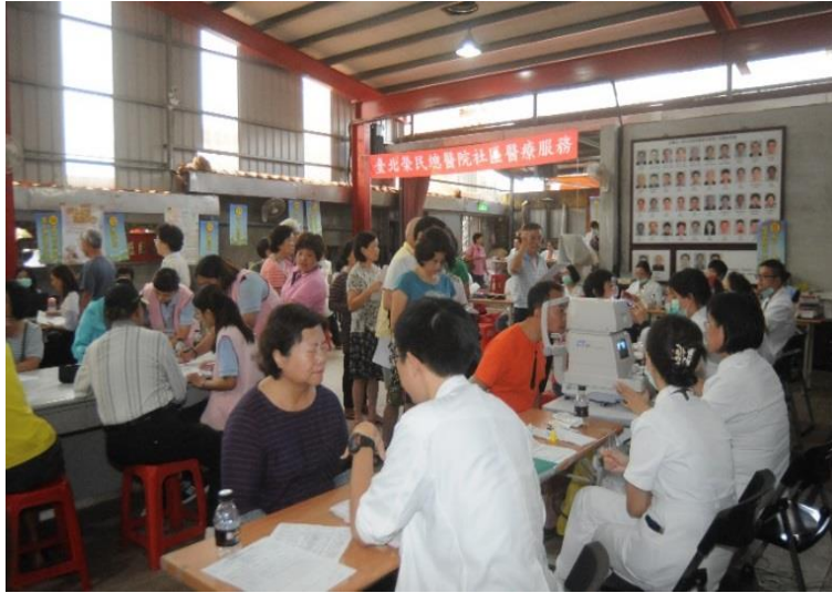
社區健康篩檢活動現場