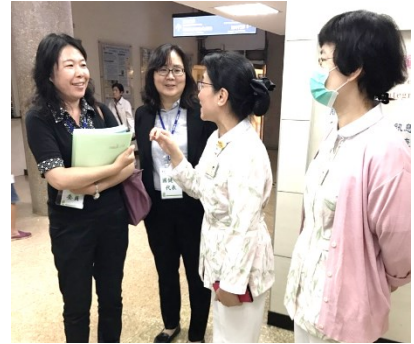
健康醫院認證作業實地訪查實況