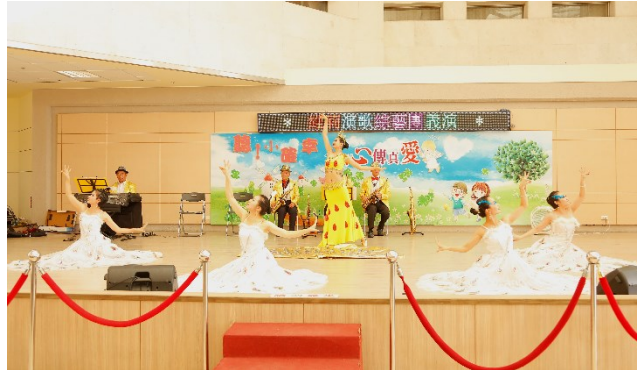
「維莉演歌綜藝團」愛心義演

四、中午 12 時於中正樓 1 樓大廳，社會工作室舉辦愛心義演活動，由「維莉演歌綜藝團」演出。(活動)