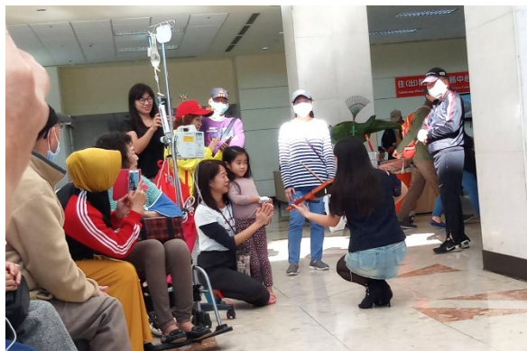
「勾勾手表演藝術團」小提琴演奏

四、下午 2 時於中正樓 1 樓營養部營養講堂，舉辦樂活午茶系列「動齡關鍵-『保密』防跌營養」講座。(活動)