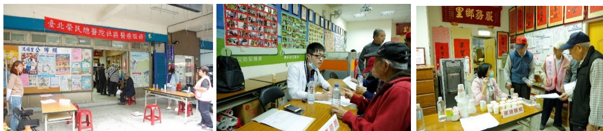
鴻福里眷村巡迴醫療服務花絮

二、上午 8 時 30 分於臺北市南港區鴻福里里長辦公室，本院社會工作室辦理眷村巡迴醫療服務，以三高篩檢為主題，實施內容包括量血壓、量體重、尿糖尿蛋白篩檢、營養諮詢、護理諮詢及醫療諮詢等項目。(活動)