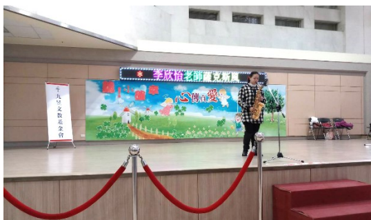
「九昱文教基金會」薩克斯風演奏