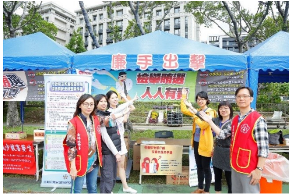
反貪「廉」署活動現場