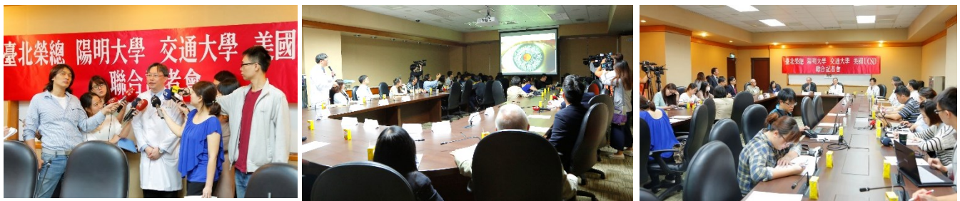
「幹細胞技術新突破：視網膜再生不是夢！」記者會現場

四、下午 2 時於中正樓 4 樓行政第 1 會議室，召開「行政院列管重大公共建設執行督導會議第 53 次會議、重大工程暨行政專案督導會報第 222 次會議」，由李副院長發耀主持。(會議)會中重要決議摘錄如下：