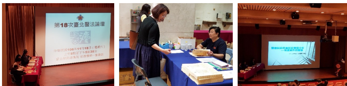
「臺北醫法論壇」活動花絮

上午8時45分於致德樓1樓第1會議室，本院內科部臨床毒物與職業醫學科舉辦「第18次臺北醫法論壇」。(活動)本院一向關心醫界發展、醫療服務品質與醫療糾紛之處理，惟醫法專業間缺乏「事務層級之溝通管道」，為此本院與臺灣法學會、臺灣刑事法學會、臺北市與縣醫師公會、醫事法律學會、臺中市醫事法學會等單位合作，每年舉辦「臺北醫法論壇」二次，以文會友，與法界人士互相與談，溝通瞭解，提高醫療服務品質，深獲好評也引起醫界與法界之重視。