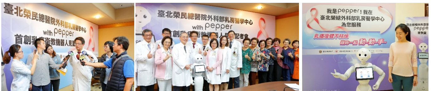
「乳癌衛教機器人 Pepper 微電影首映暨見面記者會」現場花絮