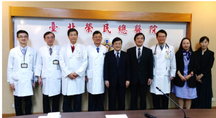
高副院長壽延(左 4)與日本山梨大學島內真路校長等外賓合影留念