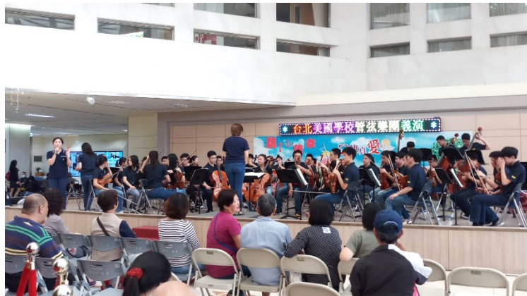
「臺北美國學校」管弦樂團義演

六、中午 12 時於中正樓 1 樓大廳，社會工作室舉辦管弦樂團愛心慈善演奏會，由「臺北美國學校」演出。(活動)