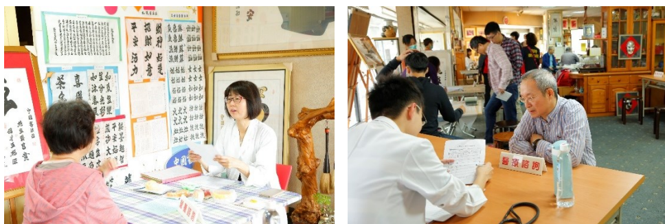
「內湖區西康里治磐新村里長辦公室」社區醫療服務現場

篩檢為主題，實施內容包括量血壓、量體重、尿糖尿蛋白篩檢、營養諮詢、護理諮詢及醫療諮詢等項目。(活動)