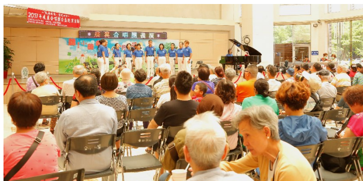
「展翼合唱團」蒞院義演

二、中午 12 時於中正樓 1 樓大廳舞台，社會工作室舉辦愛心義演活動，由「展翼合唱團」蒞院義演。(活動)