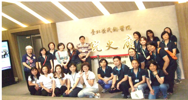
「臺北自來水事業處暨所屬工程總隊」蒞院參訪