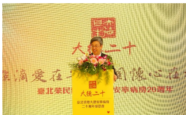
本院舉辦大德病房成立二十週年感恩會 陳副總統建仁蒞臨致詞

下傳：「天地之大德曰生」，彰顯莊嚴生命、安寧療護的意義。感謝 20 年來各界的善心，工作人員用心付出，協助數千名的病人及家屬安然渡過人生之幽谷，勇敢面對生命的歷程。大德安寧病房除專業的醫療團隊，更延攬社會心理、靈性關懷、美術療育、音樂治療、物理治療、氣功調理等專業人士，結合多元傳統中醫、芳香輔療、陪伴犬療癒等輔助整合治療，以跨專業團隊輔以專業培訓志工，共同維繫末期病人的尊嚴及高品質的醫療照護環境。期許未來，不論是安寧療護品質或是醫學研究的方向，能邁向新的里程碑，發揮更大的影響力，朝著下一個十年邁進。