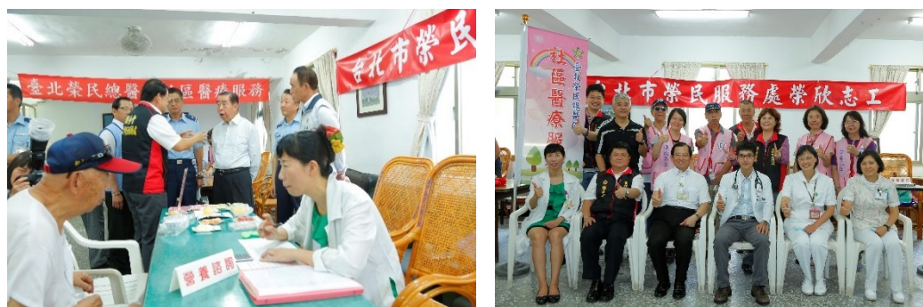
「芳蘭退舍、興隆退舍、公館退舍」社區醫療服務

二、上午 8 時 30 分於芳蘭退舍、興隆退舍、公館退舍等，社會工作室配合輔導會辦理北部地區眷村及退舍提供巡迴醫療服務。(活動)