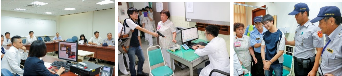
「醫療暴力應變實況演練」會議，由向主任秘書主持(左圖) 實況演練現場(中、右圖)

員言語辱罵，並持 BB 槍在診間掃射。門診人員立即按下緊急通報腕錶及撥打 110 報案電話，駐衛警及保全立即趕赴現場處理，轄區永明派出所出動警網支援，將暴力滋事者以現行犯逮捕，演練過程逼真。