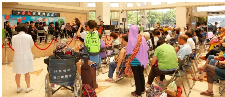
「雅風音樂弦樂團」蒞院義演

五、中午 12 時於中正樓 1 樓大廳舞台，社會工作室舉辦愛心義演活動，由「雅風音樂弦樂團」蒞院義演。(活動)