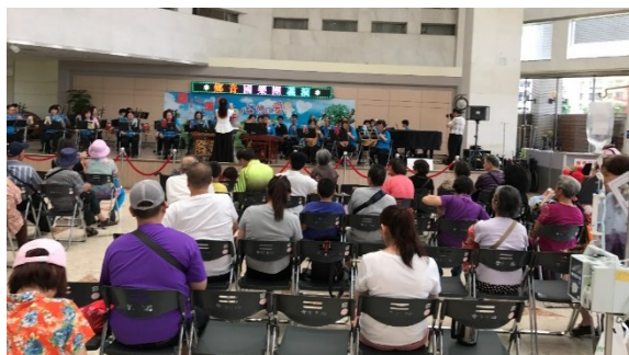
「鄉音國樂團」蒞院義演

四、中午 12 時於中正樓 1 樓大廳舞台，社會工作室舉辦愛心義演活動，由「鄉音國樂團」蒞院義演。(活動)