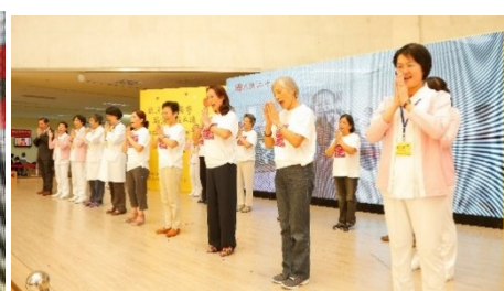
陳副總統建仁與李主任委員翔宙(圖左) 陳副總統建仁與開辦病房有功人員合影(圖中) 全體合唱「感恩的心」(圖右)