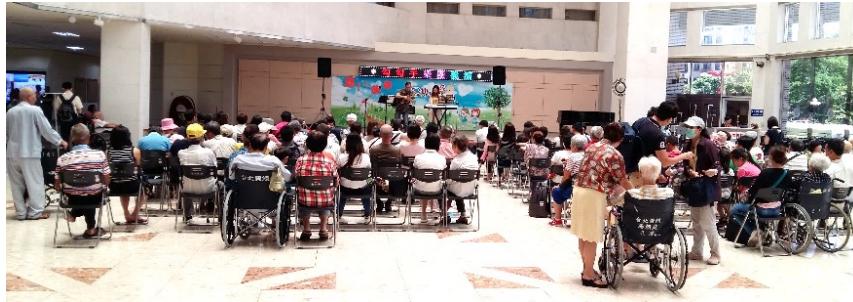
「勾勾手表演藝術團」蒞院義演