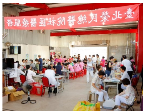
「社區健康篩檢活動」現場