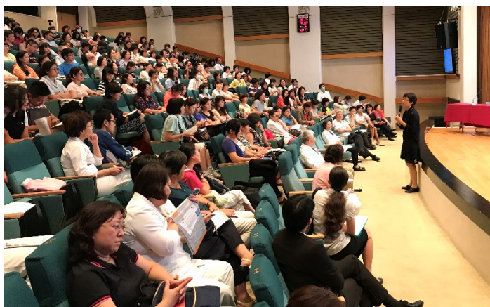
衛生福利部健康照護司蔡淑鳳司長專題演說現場

耕長照領域，累積許多寶貴經驗，可作為國內醫療機構配合政府長照 2.0 政策的參考。