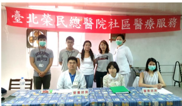
「臺北市文山區忠勤三莊」社區醫療服務