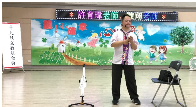
「九昱文教基金會」表演數位吹管