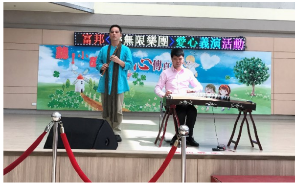
「富邦身心障礙才藝獎」得獎者表演

三、下午 2 時於中正樓 4 樓行政第 2 會議室，召開「本院 106 年醫師創新(改良)獎複審會會議」，由黃副院長信彰主持。(會議)會中重要決議摘錄如下：