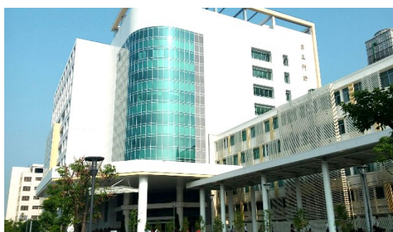
「第三門診大樓」大樓外觀