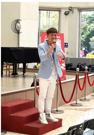
「暉騰建設公益演唱會」現場