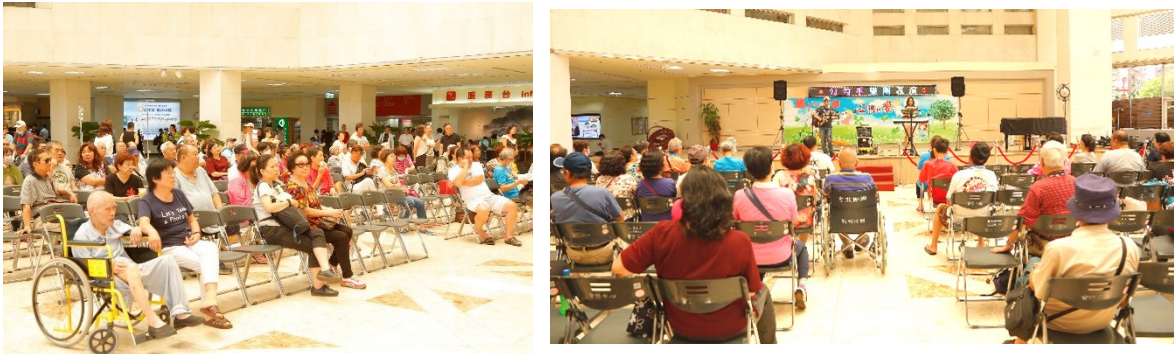
「勾勾手表演藝術團」義演現場

一、中午12時於中正樓1樓大廳，社會工作室舉辦愛心音樂演奏會，由「勾勾手表演藝術團」義演。(活動)