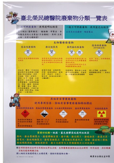
本院廢棄物分類一覽表

一、本院 107 年 3 月 22 日北總職字第 1071300035 號函修正本院廢棄物分類及處理辦法。(規定)請各單位依辦法進行廢棄物分類及依說明事項配合辦理。