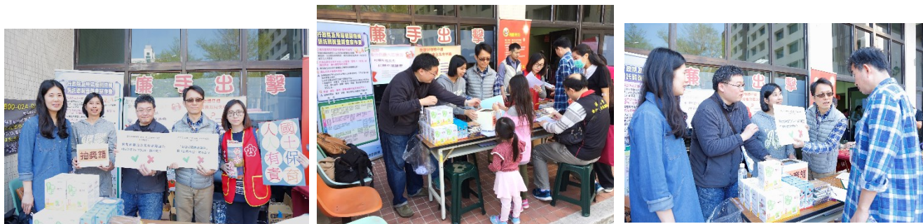
「廉手出擊」廉能宣導活動花絮