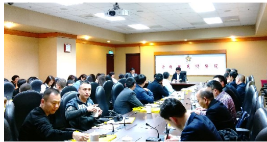
大陸「四川省遂寧市暨南充市醫事參訪團」參訪花絮