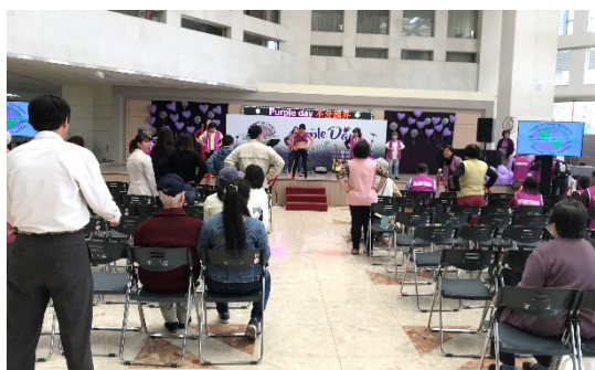
「社團法人台灣超越巔峰關懷癩癩聯盟」演出花絮