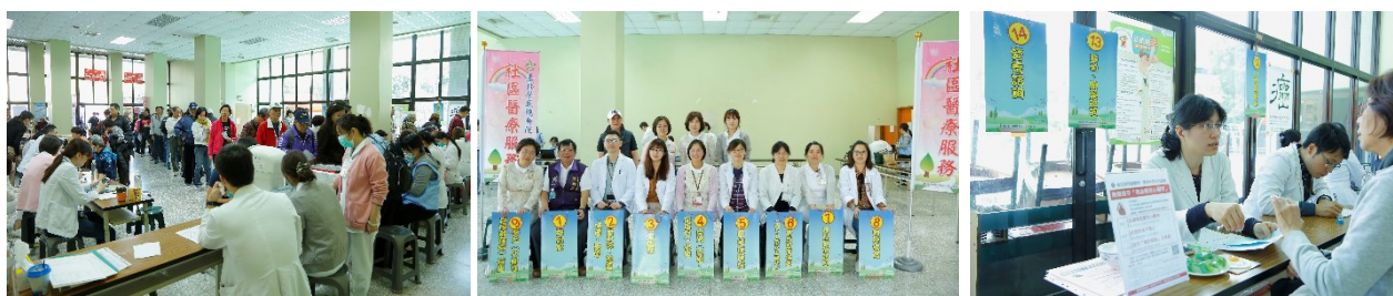
「永欣里一本院孝威館 社區醫療服務」活動花絮