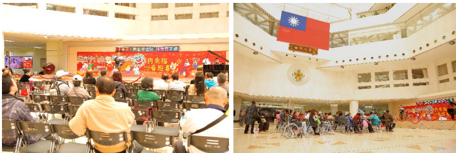
「財團法人九昱文教基金會」邀請視障藝人演出花絮

四、中午 12 時於中正樓 1 樓大廳舞台，社會工作室舉辦愛心義演活動，由「財團法人九昱文教基金會」演出。(活動)