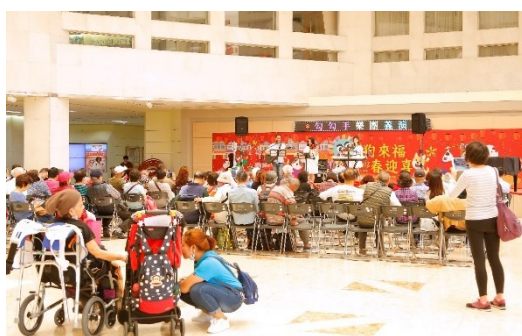
「勾勾手表演藝術團」演出花絮

二、中午 12 時於中正樓 1 樓大廳舞台，社會工作室舉辦愛心義演活動，由「勾勾手表演藝術團」演出。(活動)