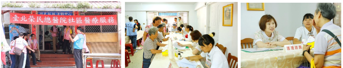
「內湖區湖光新城大型眷村巡迴醫療服務」活動花絮

三、配合國軍退除役官兵輔導委員會 107 年度辦理臺北市大型眷村巡迴醫療服務，上午 8 時 30 分於內湖區湖光新城，社會工作室提供量血壓、量體重、量腰圍、尿糖尿蛋白篩檢、營養諮詢、護理諮詢及醫療諮詢等。（活動）