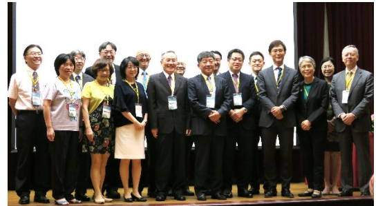
「台日幹細胞治療與再生醫學研討會」活動花絮