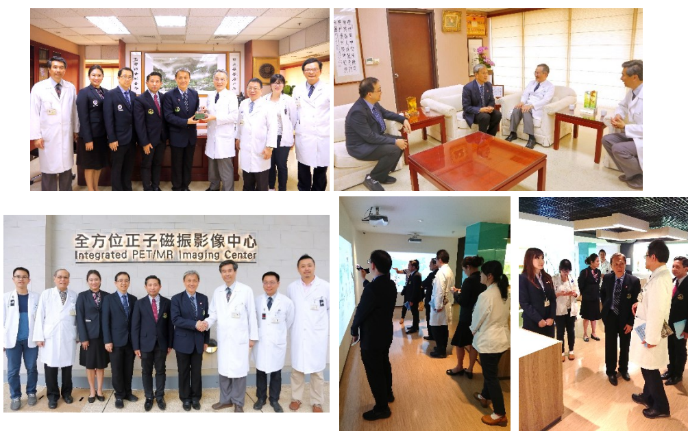
「泰國瑪希敦大學參訪團」活動花絮