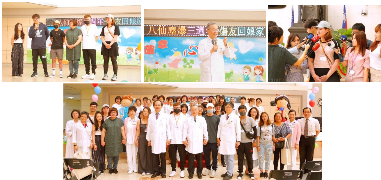
「八仙塵爆三週年 臺北榮總傷友回娘家」活動花絮

為了解八仙塵爆傷友身心復原狀況，提供傷友暨家屬治療經驗交流分享的機會，於八仙塵爆三週年，舉辦傷友回娘家活動，會中將播放回顧影片，紀錄醫療團隊及傷友共同為生命努力不懈的奮鬥歷程。