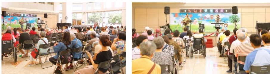
「勾勾手表演藝術團」演出花絮