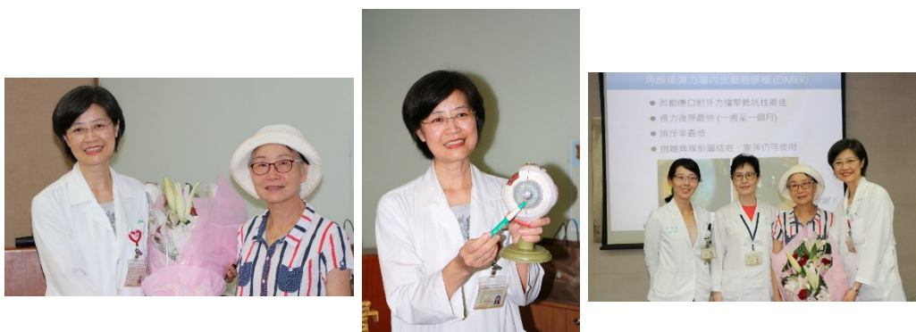
眼科部「微創角膜後彈力層內皮移植手術」記者會花絮

即原本不適合捐贈，現在因為只移植角膜後彈力層內皮，都可以捐贈。且縱使年長的捐贈者，只要通過評估也可如願捐贈，大幅增加適用的捐贈角膜，改善國內捐贈角膜嚴重短缺問題，可幫助更多需角膜移植患者重見光明。