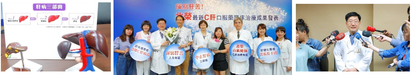
圖左:肝病三部曲模型