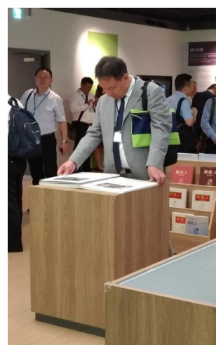
大陸「四川省腫瘤醫院醫事參訪團」活動花絮