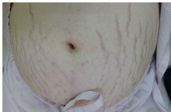
右圖：腹部暗紫色條紋

二、本院 107 年 7 月 30 日北總補字第 1070600492 號函示本院「總院暨分院租賃醫療儀器設備管理程序書」。(規定)