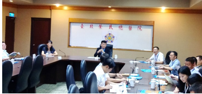
「四川省攀枝花中心醫院暨第二人民醫院醫事參訪團」活動花絮