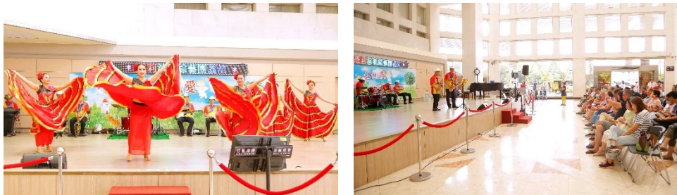
「維莉演歌綜藝團」義演花絮

五、中午 12 時於中正樓 1 樓大廳舞台，社會工作室舉辦義演活動，由「維莉演歌綜藝團」演出。(活動)