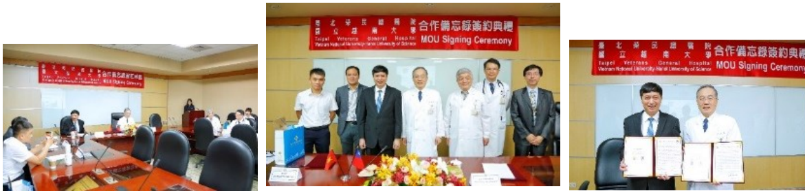
「本院與越南國立大學簽署合作備忘錄典禮」