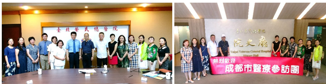
「四川省成都市公共衛生臨床醫療中心參訪團」活動花絮