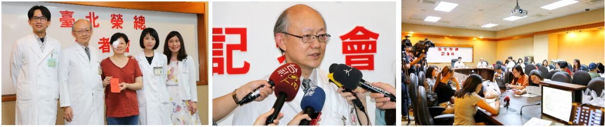
「眼睛也會長惡性黑色素瘤？不可忽視的眼睛黑斑！」記者會花絮