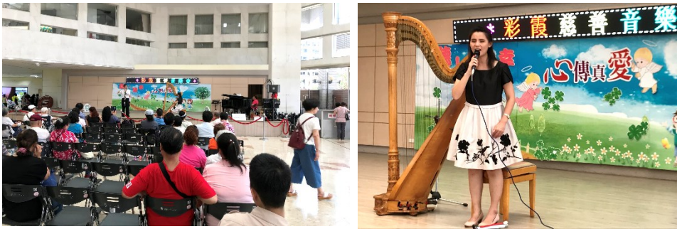
「彩霞慈善音樂會」愛心義演

二、中午 12 時於中正樓 1 樓大廳舞台，社會工作室舉辦愛心義演活動，由「彩霞慈善音樂會」演出。(活動)