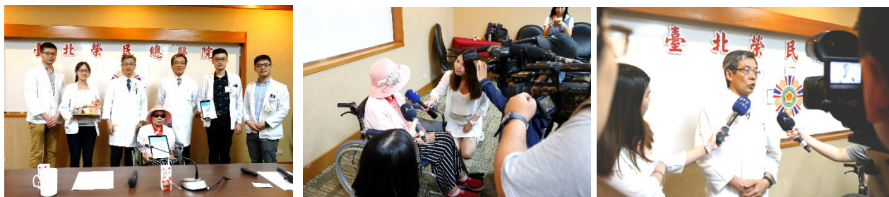
「聽能復健 APP 聽損復健更便利」記者會花絮