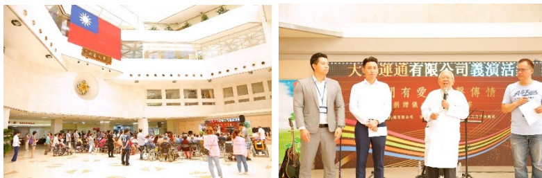
「大亞運通有限公司」演出花絮

二、中午12時於中正樓1樓大廳舞台，家庭醫學部舉辦義演活動，由「大亞運通有限公司」演出。(活動)