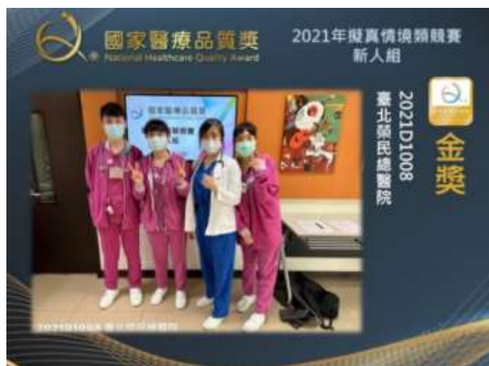
本院新人組團隊榮獲金獎殊榮