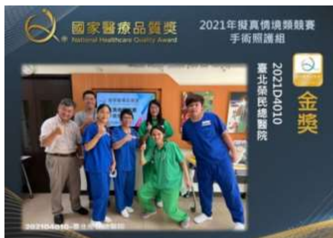
本院手術照護組榮獲金獎殊榮

一、本院手術照護組及新人組團隊，在全國 59 個隊伍脫穎而出，榮獲 2021 年醫策會國家醫療獎「擬真情境類競賽」金牌，並再次奪下全國唯一單一機構兩金的殊榮。(活動)自 104 年至 110 年，本院共累積獲得六金、一銀、二銅獎、一優選、四潛力等獎項，成果斐然。