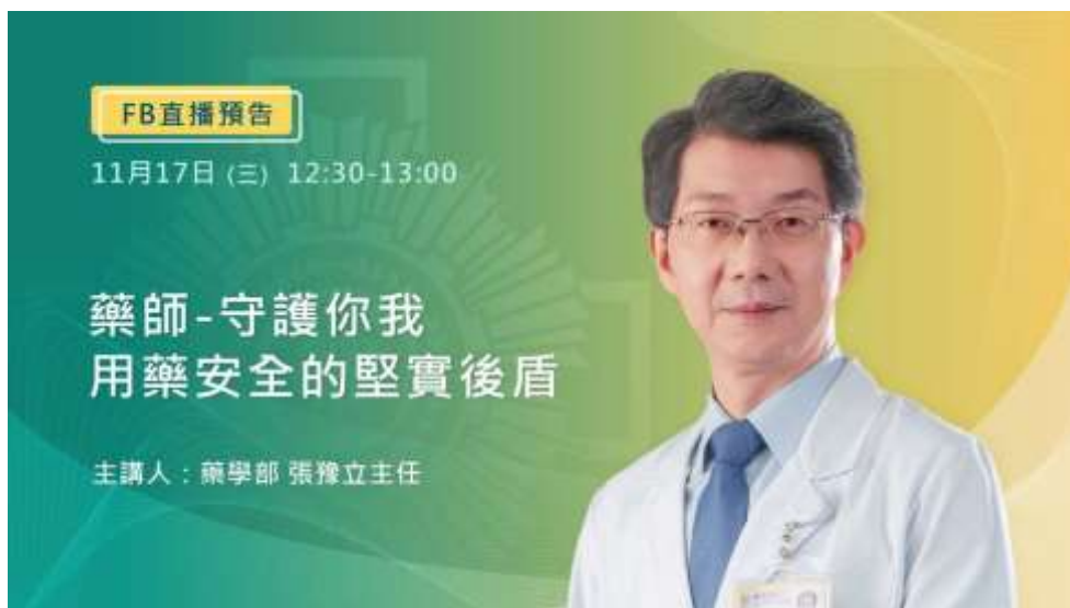
「藥師—守護你我用藥安全的堅實後盾」線上直播活動海報