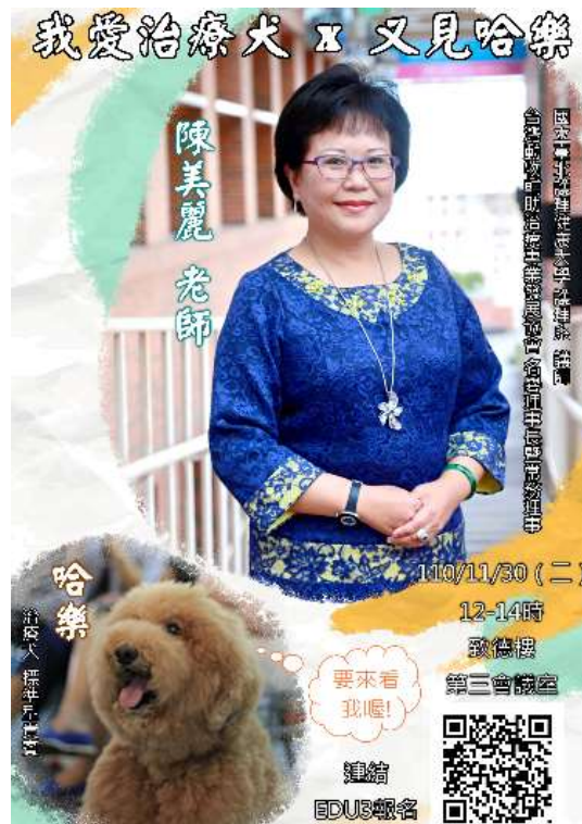
「我愛治療犬 X 又見哈樂」身心靈關懷講座活動海報

二、下午 2 時 30 分辦理本院「VR 教材介紹及臨床應用—口腔癌專案」教學部線上講座，由黃意嬪副護理長主講。(活動)