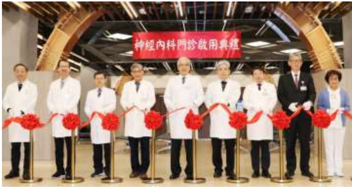
神內門診整建完成剪綵啟用