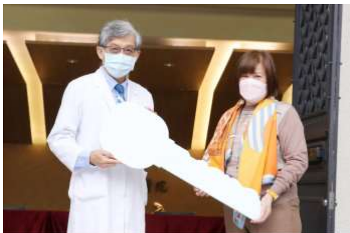
馬副院長代表受贈