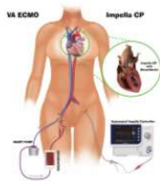
葉克膜維生系統由病人右股頸插入 經皮式心室輔助器由病人左股頸插入

一、上午 10 時，於本院中正 4 樓行政第一會議室舉行外科部記者會，主題：「免開胸經皮式心室輔助器成功搶救急性心衰竭產婦」。(活動)