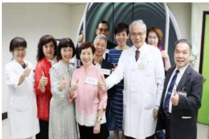
企業善心捐贈平衡評估訓練設備