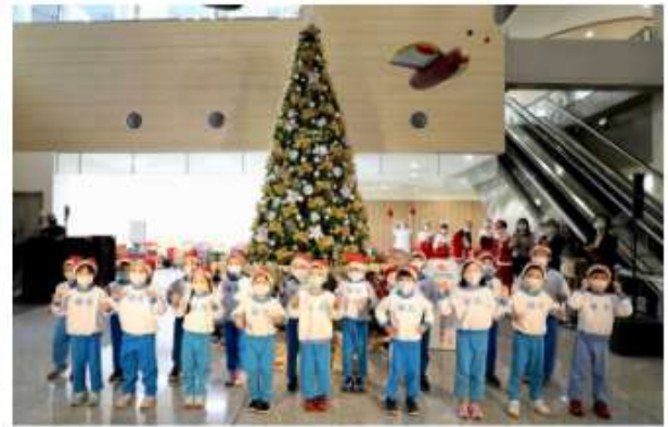
榮光幼兒園小朋友表演聖誕組曲