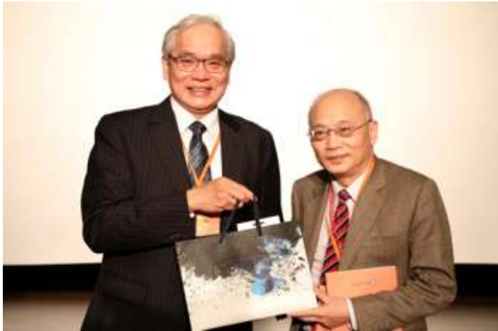
北榮故宮合作發表認知卡