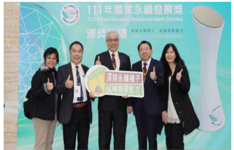
臺北榮總團隊合影