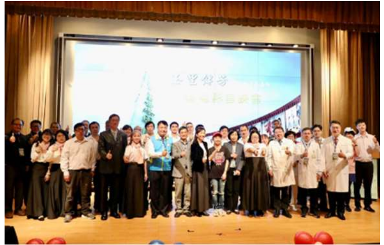
全體與會人員合影