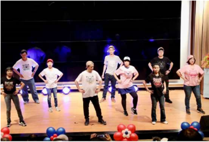
北榮日間病房學員熱舞表演