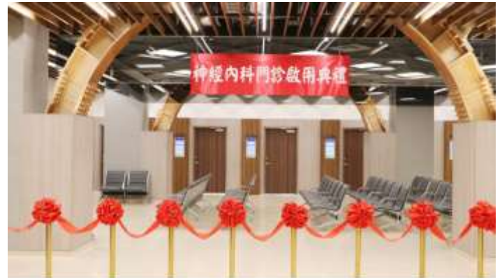
保留特色鋼構拱門