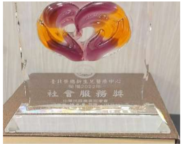
新生兒醫療中心推動親子共讀成效卓越，獲頒“社會服務獎”