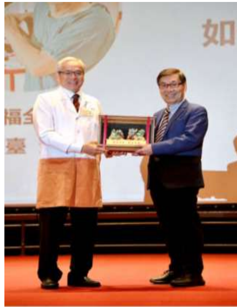
臺北榮總致贈紀念品

一、上午 10 時，於本院中正 4 樓行政第一會議室舉行外科部記者會，主題：「免開胸經皮式心室輔助器成功搶救急性心衰竭產婦」。(活動)