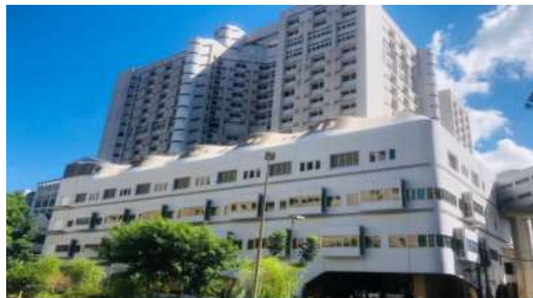
北榮智慧型手術大樓外觀