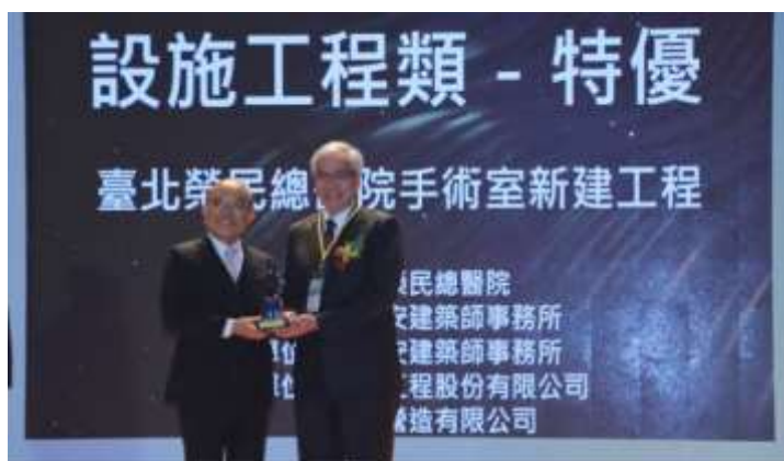
北榮智慧型手術大樓獲頒公共工程金質獎設施工程類特優，由行政院蘇貞昌院長頒獎，北榮陳威明院長(右)代表領獎