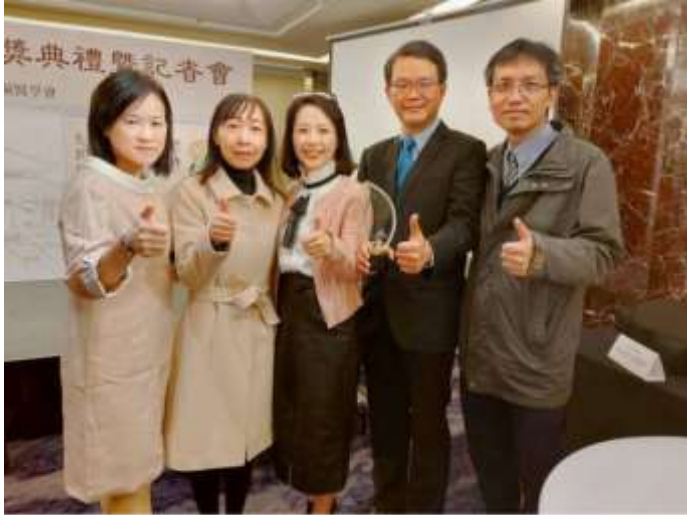
北榮腎病防治團隊與國健署魏璽倫副署長(中)合影