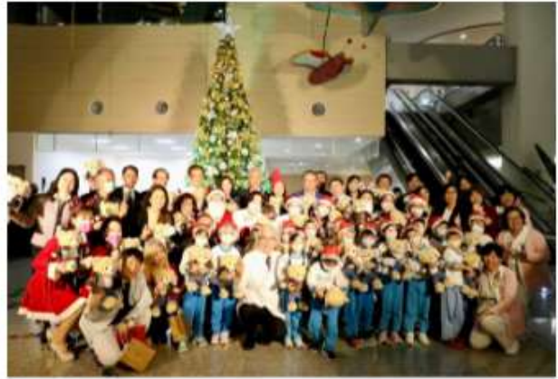
東大扶輪社致贈2023年泰迪熊玩偶，讓所有參與人員度過歡樂、溫馨的夜晚