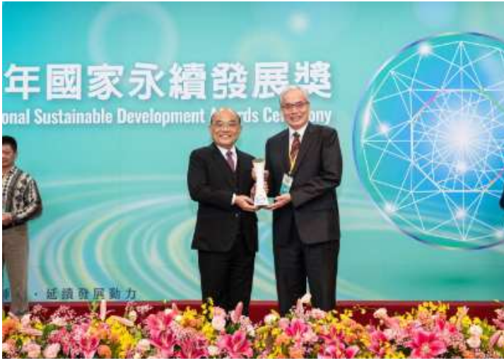
臺北榮總陳威明院長（右）領取國家永續發展獎獎座