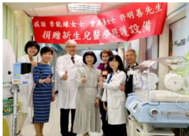
企業善心捐贈新生兒照護設備