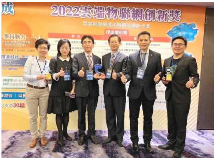
臺北榮總團隊合影