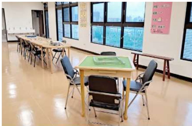
稻香日照中心休閒設施