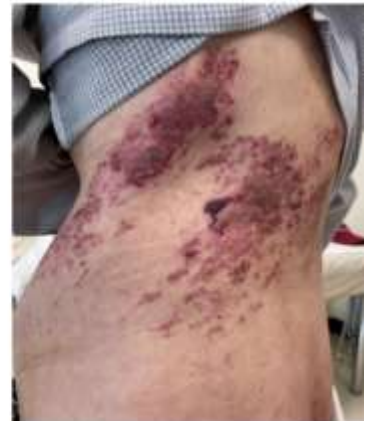
帶狀皰疹（俗稱皮蛇）