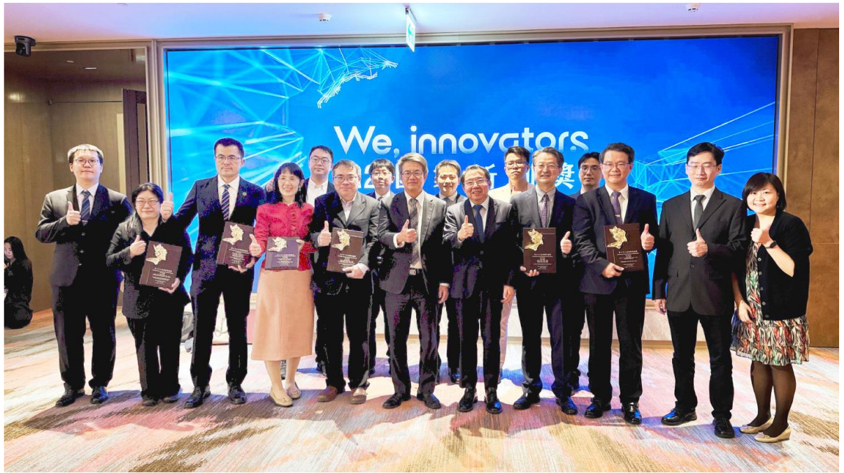
北榮六大團隊獲國家新創獎肯定 展現臨床、研究創新成果