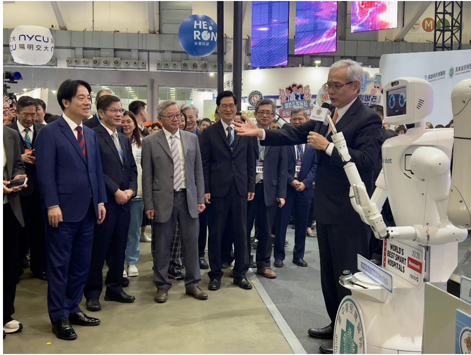
賴總統清德蒞臨榮民醫療體系展區，現場由陳院長威明(右)向總統解說醫療機器人現況