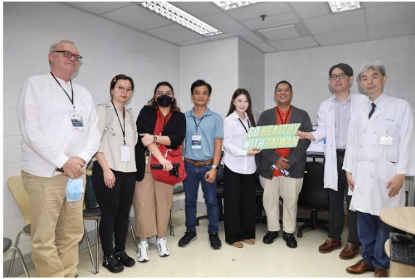
參訪肝癌CT影像AI輔助偵測工作室