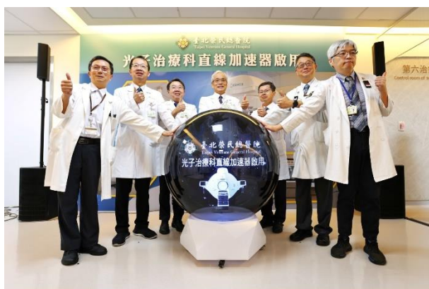
北榮光子治療直線加速器啟用 打造全方位放射醫療