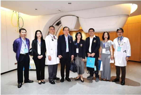
參觀重粒子癌症治療中心治療室

療交流參訪。此訪團係由衛福部資訊處指導與工研院產業科技國際策略發展所協助安排，為強化落實臺泰雙方於 AI 智慧醫療領域合作，未來，本院將持續整合臨床專業與 AI 創新量能，攜手泰國醫療機構展開跨國驗證、臨床試驗與責任導向 AI 顧問合作，致力打造具有溫度與信任的智慧健康國際合作典範。(活動)