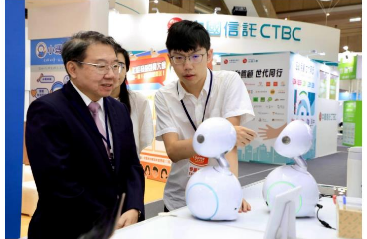
AI 居家醫療 × 智慧量測，守護健康零距離