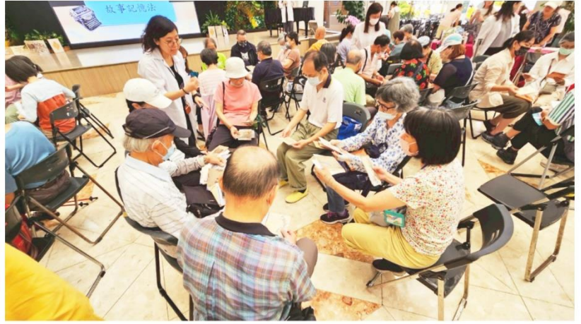
民眾實際運用今牌人生牌卡，以說故事的方式增進記憶與表達力。