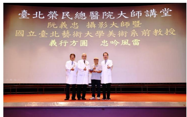
臺北榮總團隊與阮義忠大師合影

三、下午 2 時於中正樓四樓行政第 1 會議室召開「114 年度醫教奉獻獎審查會」，由王副院長署君主持。(會議)