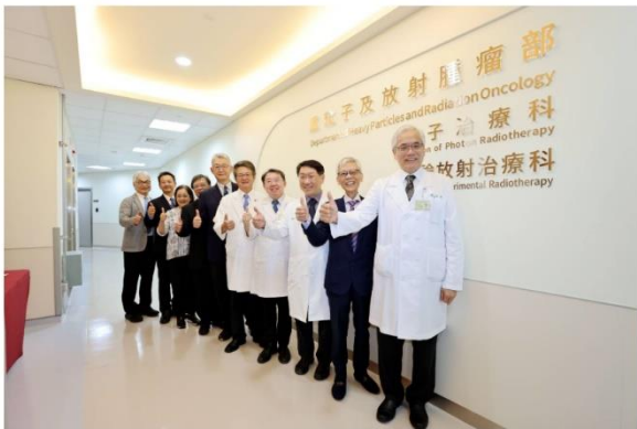
「碩中子捕獲治療中心」為癌症患者提供更多元、先進的治療選擇，帶來重獲健康的希望