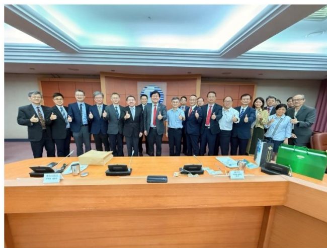
科技賦能健康未來 北榮攜手中華電信 共創產學聯盟新里程碑

二、下午 2 時於榮光樓社工室五樓會議室召開「社會工作室 114 年 9 月份室務會議」，由林副院長永煬主持。(會議)