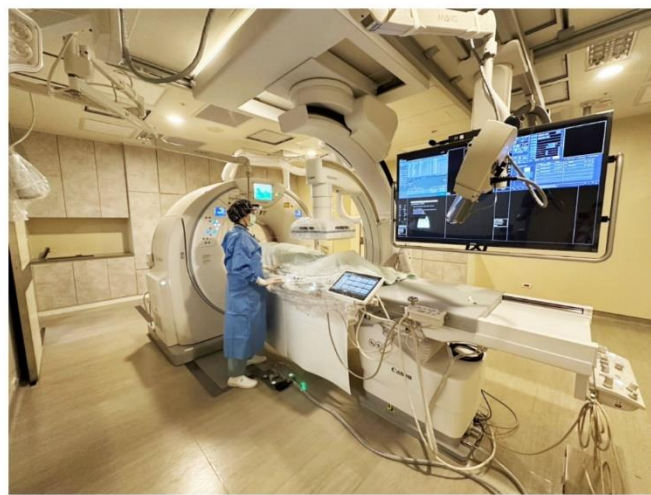
圖一 新式複合式血管攝影暨CT