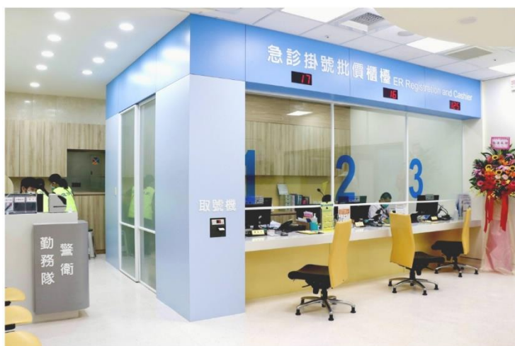
嶄新的批價掛號櫃檯

二、本院急診部於今日完成急診室入口整建工程，全面優化掛號與檢傷通道動線，降低入口壅塞所造成的焦慮與不適，提供更舒適、友善的就醫環境，希藉此次急診部就醫動線與工作環境的優化工程由，擴大大門及計價櫃檯前方空間，以提升民眾就醫便利性，更營造出寬敞、安全且具人性關懷的醫療環境。(活動)