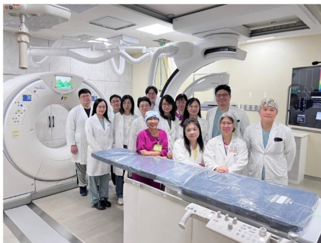
圖四 跨專業團隊合作 訂定個別化精準癌症治療策略

同時減少病人移動轉送過程的風險，提升治療安全性與效率，並推動精準醫療與微創介入治療。(活動)