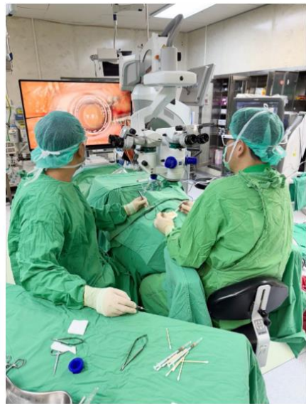
黃斑部皺褶手術示意圖