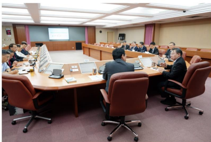
臺北榮總與中華電信將共推「國科會智慧醫療產學聯盟計畫」，成立「遠距健康中心」，打造更完整遠距健康照護生態系