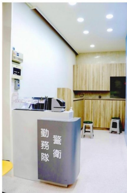
專屬警衛勤務隊空間

三、本院於今日舉辦國際醫學教育研討會—醫學教育的創新與學術發展(Innovation and Scholarship in Medical Education)，邀請國內外專家學者，包含加拿大皇后大學及美國貝勒醫學院教授進行演講及互動式工作坊，分享最新的國際趨勢、創新教學方法與評鑑策略，吸引超過 1200 位國內外醫學教育專家學者與臨床教師共襄盛舉，展現臺灣在醫學教育領域持續進步並與國際接軌的努力。(活動)