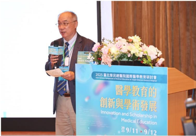
國衛院梁廣義院士演講「信賴的基石：能力導向教育中回饋、評量與其教育目的的再平衡」