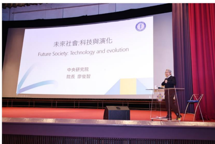
廖俊智院長以「未來社會：科技與演化」為題，帶來一場兼具深度與啟發性的演講

二、中午 12 時 15 分於介壽堂舉辦大師講堂，中央研究院廖俊智院長，以「未來社會：科技與演化」為題，帶來一場兼具深度與啟發性的演講，強調人工智慧 (AI) 正為醫療帶來革命性的影響，但「醫療的核心價值仍在於對人的關懷」，未來的醫療需同時兼具並重科技與人文，期許年輕世代能從中汲取啟發，將科技與人文的力量結合，為臺灣醫療開創更美好的未來。(活動)