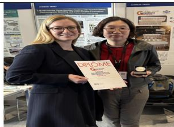
獲日內瓦發明展銀牌獎