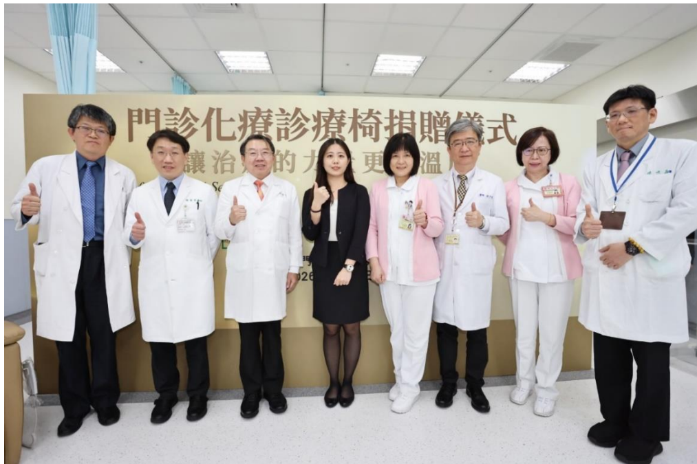
桂田恆諾基金會善心捐贈 協助提升癌症病人治療環境與整體照護品質