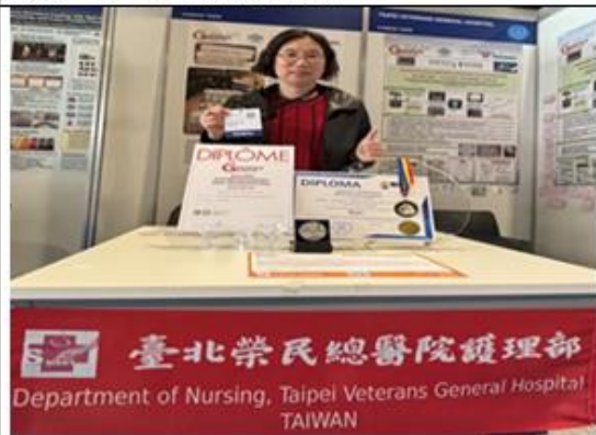
臺北榮民總醫院護理部展覽會場