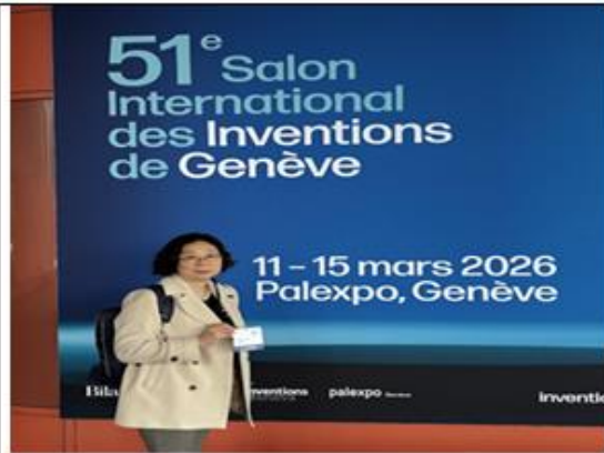
2026年3月11日日內瓦發明展開幕