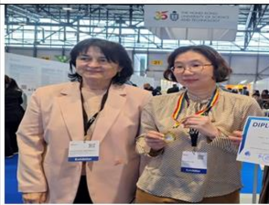
獲羅馬尼亞國家微技術研究開發院 (iMT) 頒發「傑出研究創新獎」