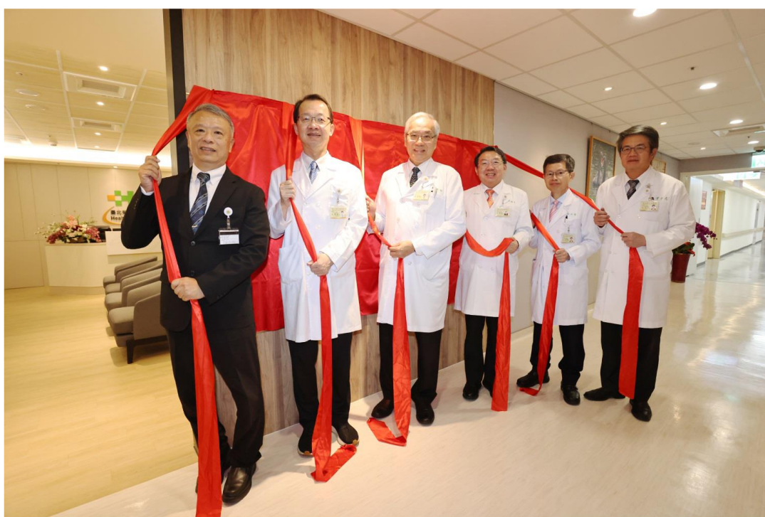
北榮健康管理中心「A154 LOUNGE」揭牌啟用 健檢服務再升級

五、本院健康管理中心「A154 LOUNGE」正式啟用，原址為胸腔外科病房，搬遷至中正樓 19 樓後，健康管理中心得以擁有 15 樓完整且專屬的服務場域。透過善心企業潤泰集團全力協助空間規劃與整建、仰德集團支持走廊環境美化，嶄新空間設計，優化動線與服務流程，提供兼具專業、舒適與隱私的高品質健檢服務，成功打造兼具功能性與人文溫度的醫療空間，守護國人健康。