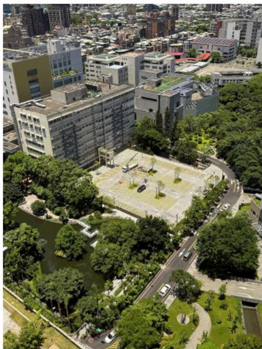
湖畔綠化停車場空拍圖(一)

配湖邊的啞哩岸石及湖內 38 隻禽鳥，打造兼具環境保護、人本設計及永續發展之空間。(活動)