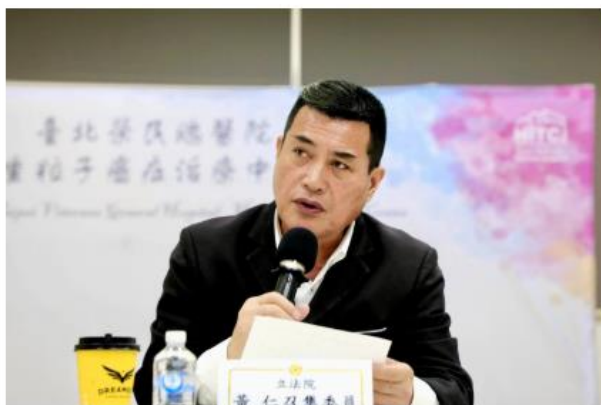
黃仁召集委視察北榮重粒子癌症治療中心