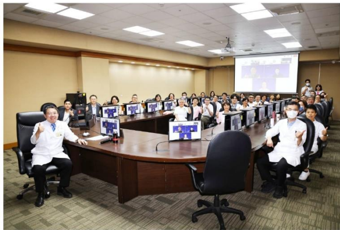
北榮認證團隊透過視訊會議，與HIMSS認證委員合影

今日本院正式通過美國醫療資訊與管理系統協會 (Healthcare Information and Management Systems Society, HIMSS) 所制定的「電子病歷應用成熟度模型 (Electronic Medical Record Adoption Model, EMRAM)」第六級認證，象徵本院在電子病歷系統的功能完整性、臨床決策支援能力與資訊安全等關鍵指標上，已達國際領先水準，充分展現本院於智慧醫療領域的深厚實力與豐碩成果。