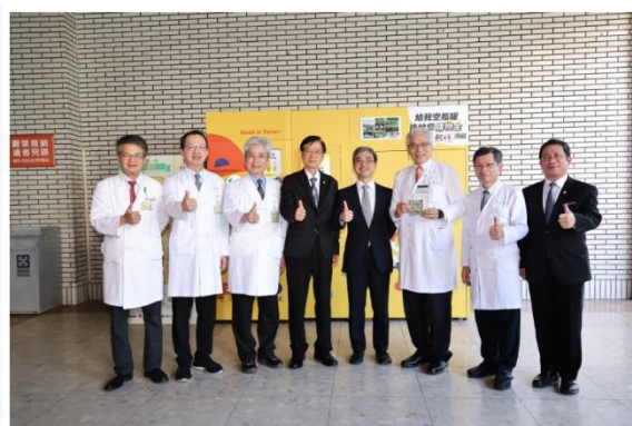
貴賓們於回收機前合影，實踐永續行動，展現醫學中心推動環保的創新典範。