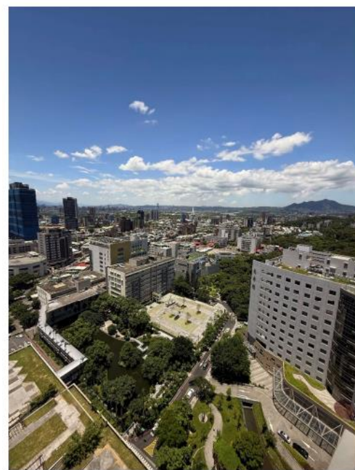
湖畔綠化停車場空拍圖(二)

潤泰捐建湖畔綠化停車場，壓花地坪與植草磚設計，提升綠化面積，與緊鄰忘憂湖融合成優美的生態景觀。