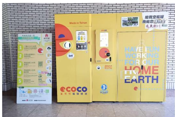
北榮率先引進智慧回收機，實現友善環境與永續生態雙重目標