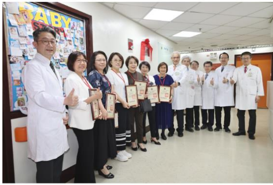
感謝善心人士慷慨捐助，終於得以全面翻修，為孕產婦及家屬提供更安全、溫馨的療癒環境