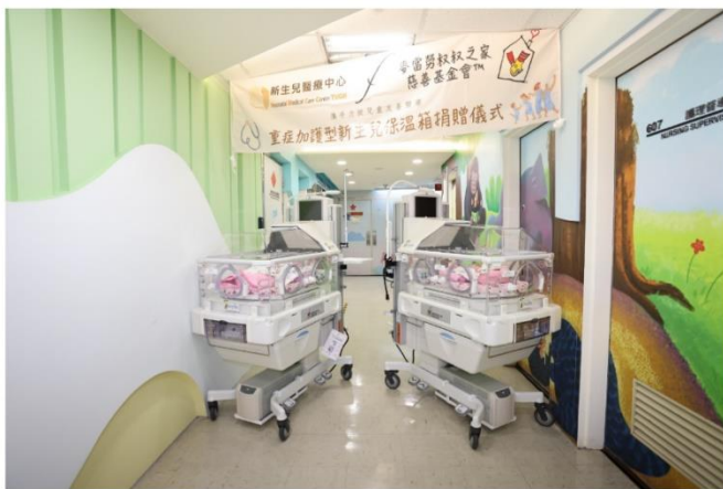
麥當勞叔叔之家捐贈二台重症加護型保溫箱 北榮新生兒照護更安心