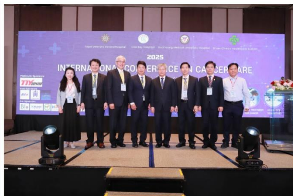
台越兩國的講者分享臨床經驗與創新技術