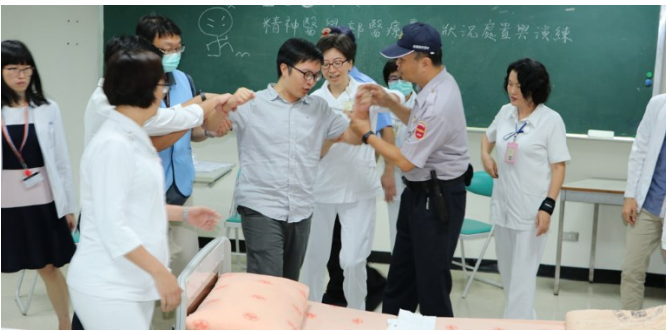
精神醫學部演練情形