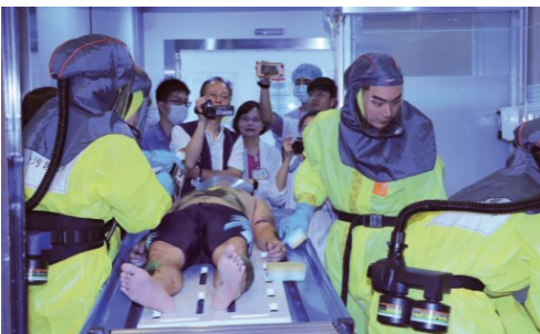
化災緊急醫療應變演練畫面