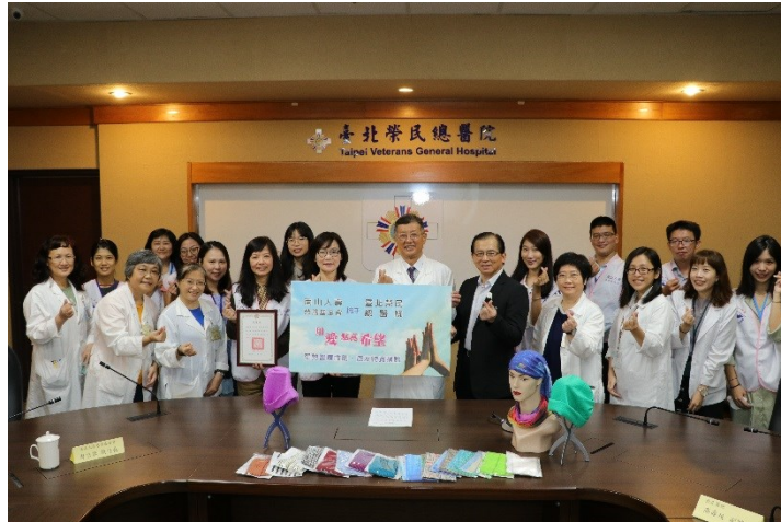
高副院長壽延(中)和與會人員合影