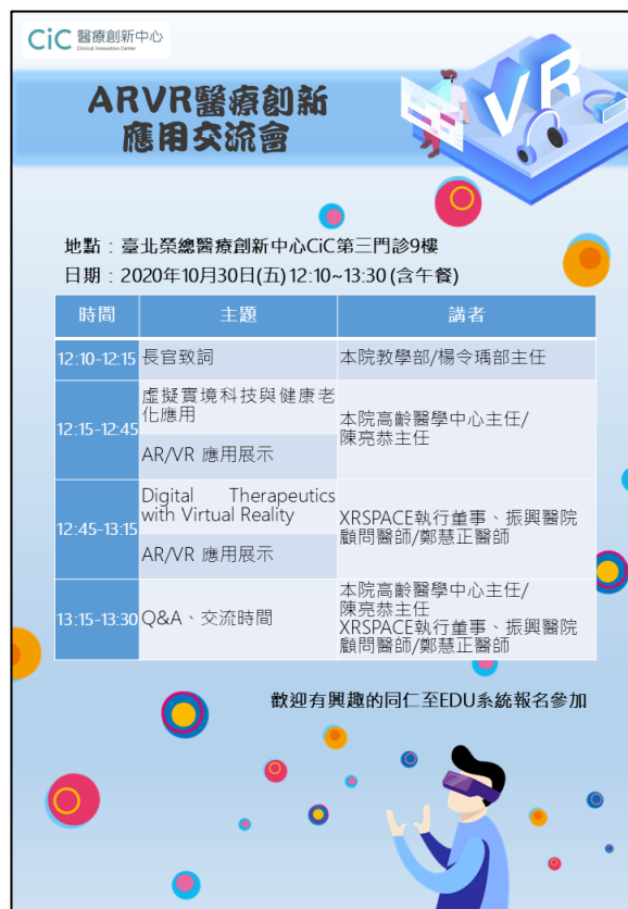
「ARVR 醫療創新應用交流會」活動海報