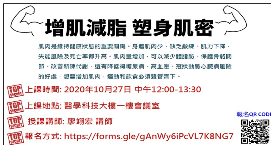
「增肌減脂 塑身肌密」活動海報