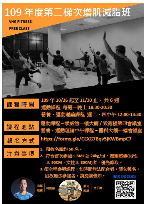
「109 年第 2 梯次增肌減脂班」活動海報