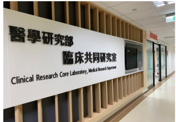
臨床共同研究室外觀