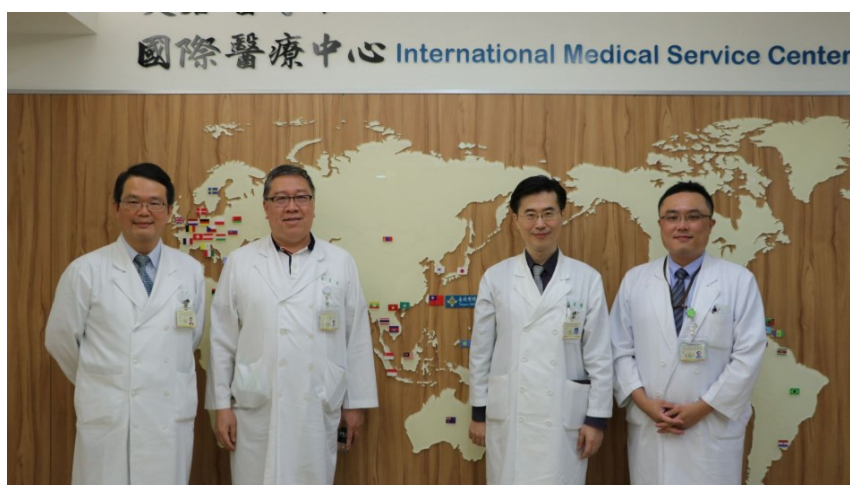
本院與會人員合影