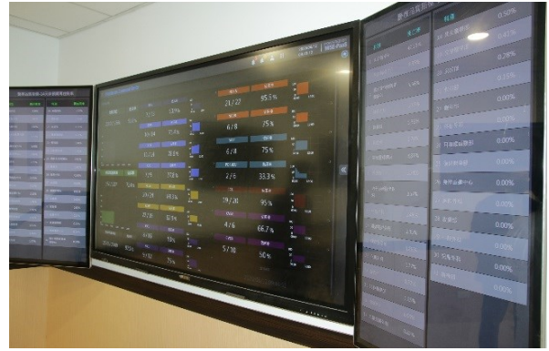
圖形化的使用介面

二、下午 1 時 30 分於中正樓 4 樓行政第 1 會議室，召開本院「醫學科技大樓管理會 109 年第 1 次會議」，由張院長德明主持。(會議)