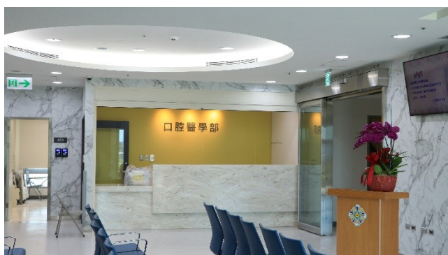
口腔醫學部外部環境