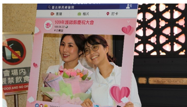
護理部自製相框，同仁拍照歡慶護師節