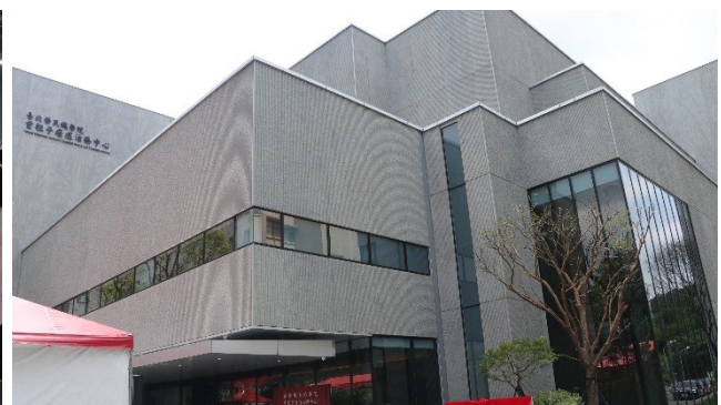
重粒子癌症治療中心外觀