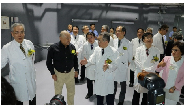
與會人員參觀重粒子治療中心內部