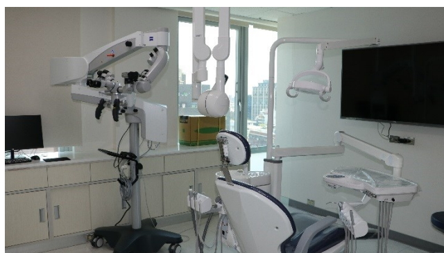
新門診顯微手術室