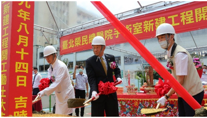
呂副主委(中)與李代理院長(左)共同進行動土儀式