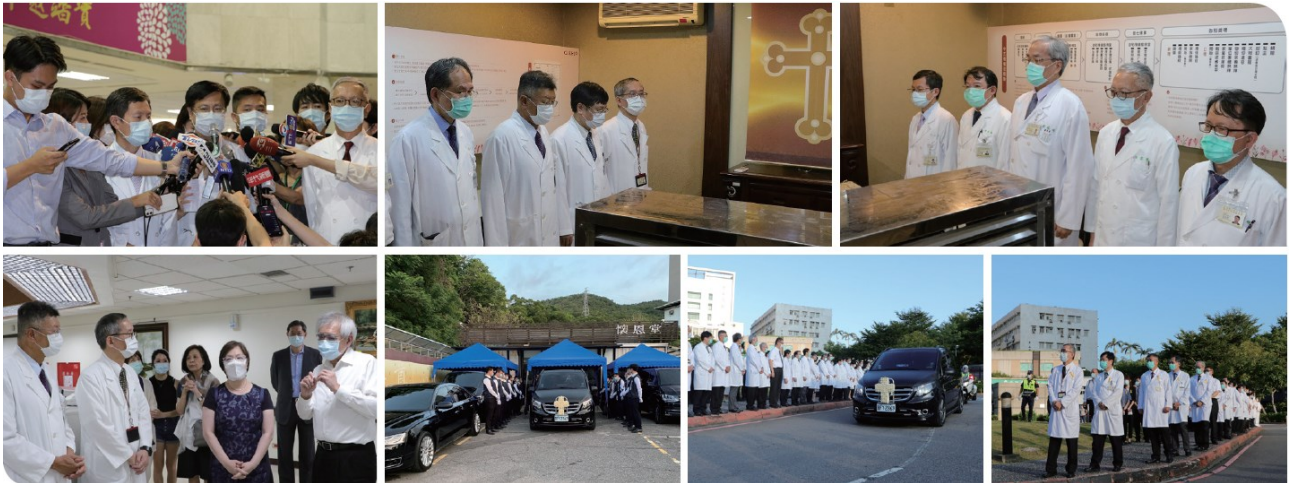
本院同仁向照護多年的李前總統登耀先生致上最高敬意

一、李前總統登輝先生於今(109)年 7 月 30 日晚間因敗血性休克及多重器官衰竭病逝於本院。今(14)日上午李前總統移靈車隊駛離前環繞本院院區，300 多名醫護及行政人員到場送李前總統最後一程，代達對李前總統之最高崇敬與致意。(活動)