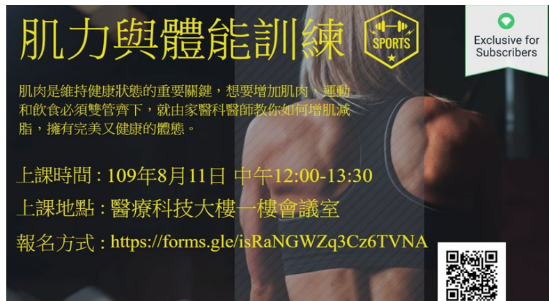
「肌力與體能訓練」講座活動海報