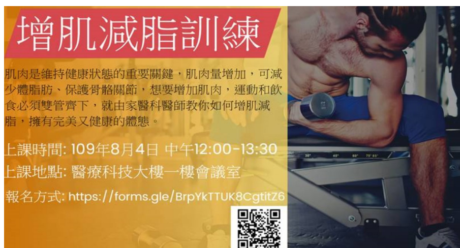
「增肌減脂訓練」講座活動海報