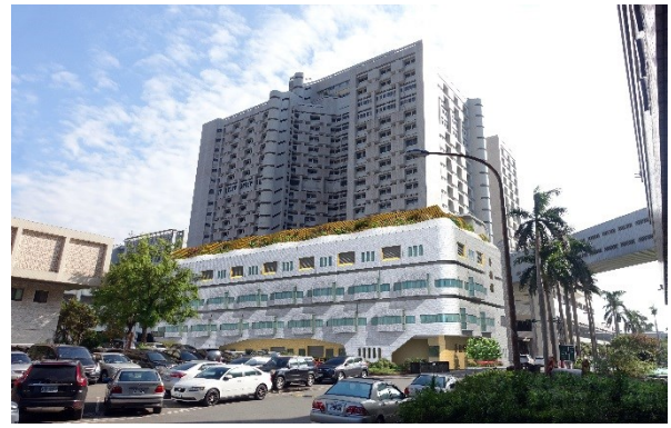
新建手術大樓外觀示意圖