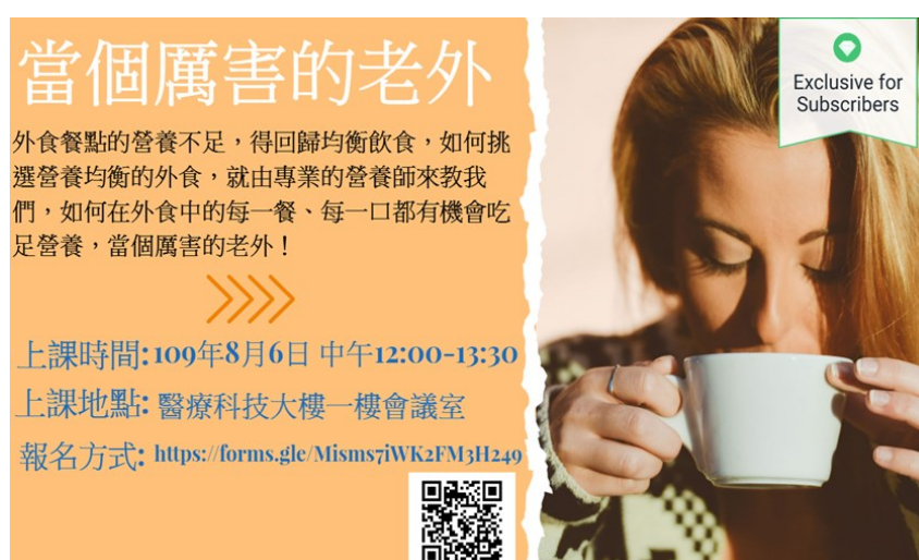
「當個厲害的老外」講座活動海報