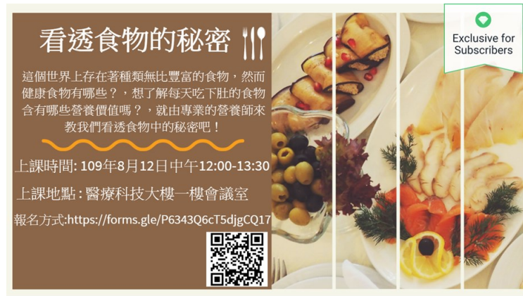
「看透食物的秘密」講座活動海報