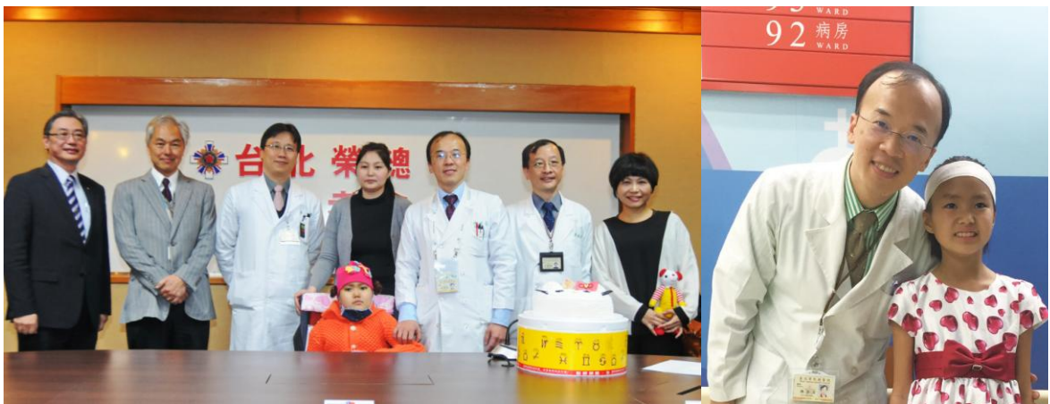
兒童神經外科團隊成功治療蒙古腦瘤病童，家屬感謝臺灣及醫療團隊