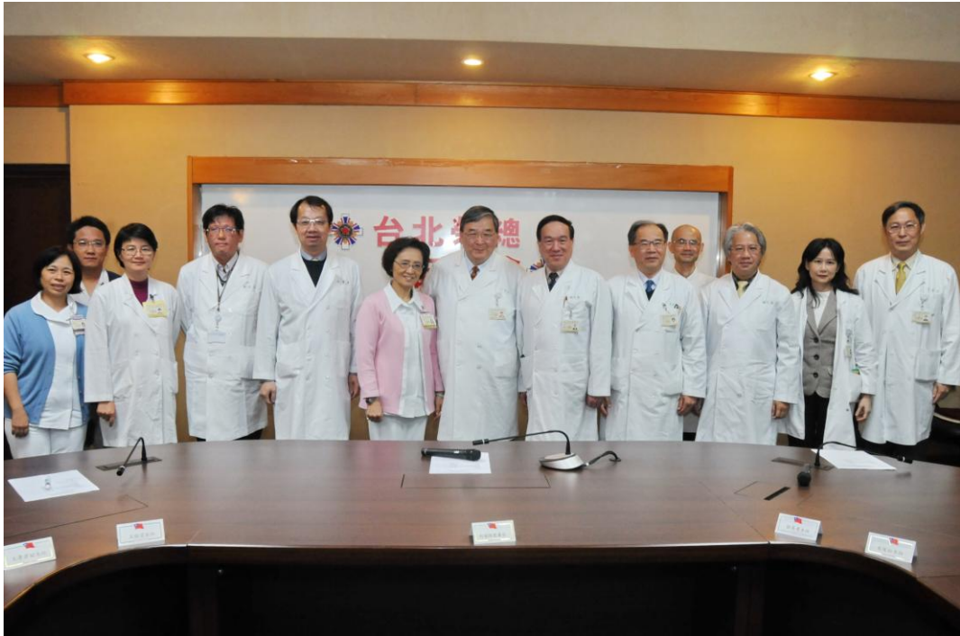
本院發展無痛醫院結合止痛醫療、教育訓練與研究，凝聚跨領域多專長醫療團隊。