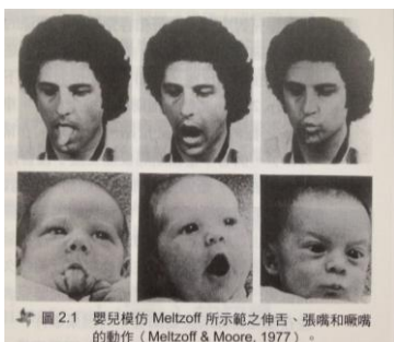
圖 2.1 嬰兒模仿 Meltzoff 所示範之伸舌、張嘴和噘嘴的動作 (Meltzoff & Moore, 1977)。

第六階段， 洞察 (insight) 階段：在【 基模內化歷程 (internalization of schemes) 】 中，孩子以能預期特定動作的結果，因而預先執行一系列的動作以達成目標，而 不需要嘗試錯誤 的探索，如：穩定地完成插棍作業、將一堆積木放入杯中。