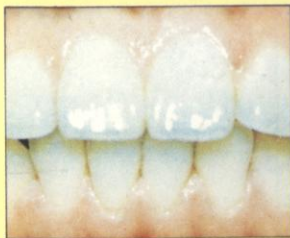
圖三：將牙齒刷清潔。