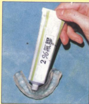
圖二：將氟膠置於載氟器上。

為了提供病患最佳的醫療服務，適當的事前預防措施，不但可以減輕患者可能發生併發症的機率，同時更可減輕副作用所產生的痛苦，所以我們極希望患者能夠充份的合作，遵守醫師之各種指示。