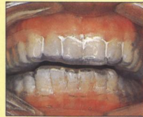
圖四：氟膠放在載氟器內，然後按在牙齒上約5-10分鐘。