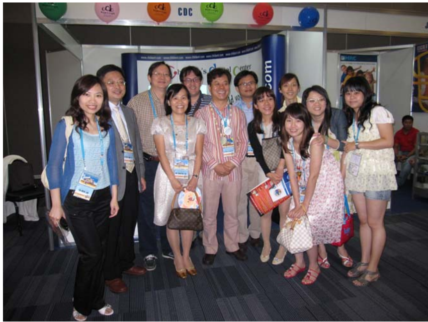
台灣兒童牙科醫師與韓國醫師於會場合影