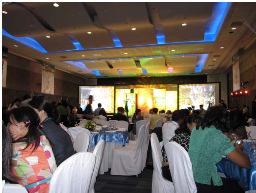
亞太兒童牙醫年會晚宴會場