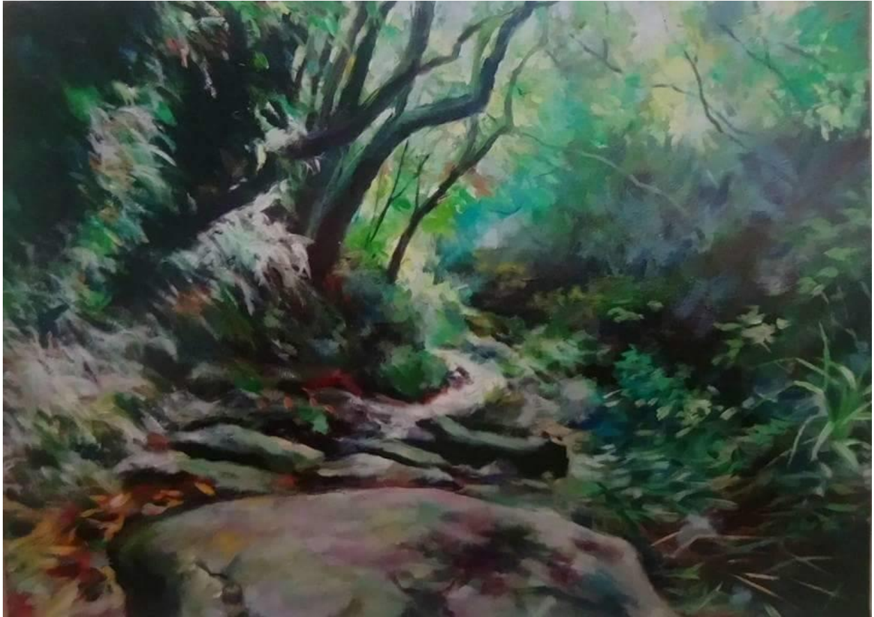
畫作說明：虎豹潭古道，綠蔭清涼，富含陰離子，風景優美，療癒身心.....