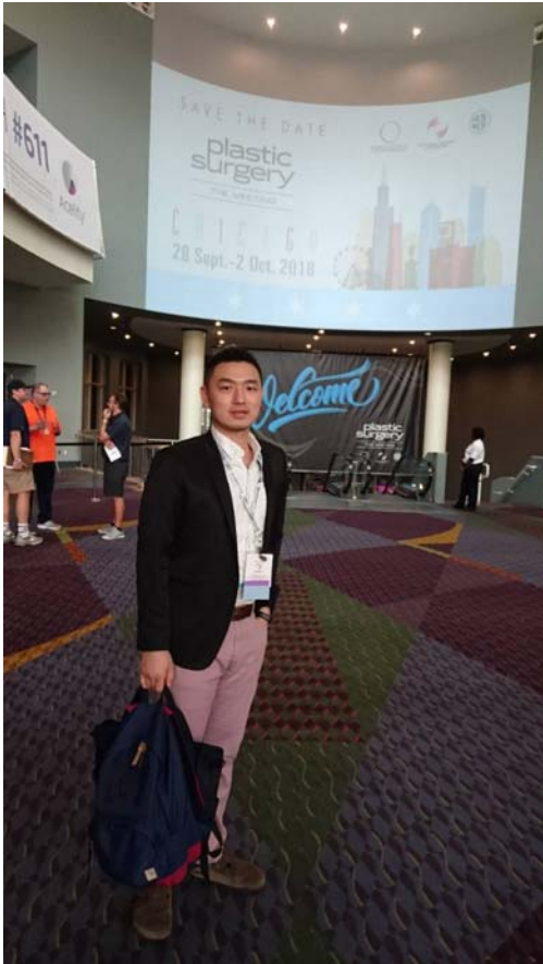
(2017-The Meeting 於美國奧蘭多橘郡會議中心會場)