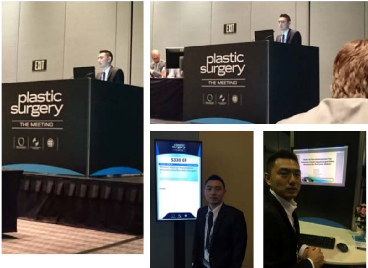
(於會中口頭及海報發表本院整型外科於去年顯微重建手術之臨床研究的結果)