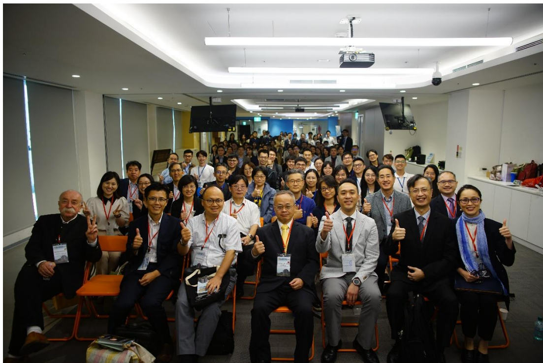
(圖)首次嗅味覺工作坊熱鬧滾滾，國內外講師學員共計 100 多人參與。