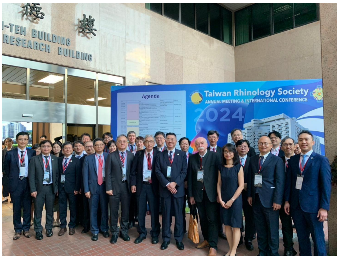
(圖)台灣鼻科醫學會理監事、日本鼻科醫學會理監事、韓國鼻科學會理監事、泰國鼻科醫學會理監事、德國來訪學者合影，攝於臺北榮總致德樓