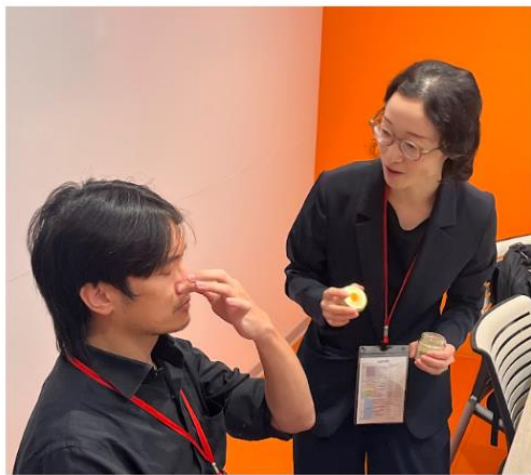
(右圖)與會的台灣醫師實際體驗嗅閾值檢查。