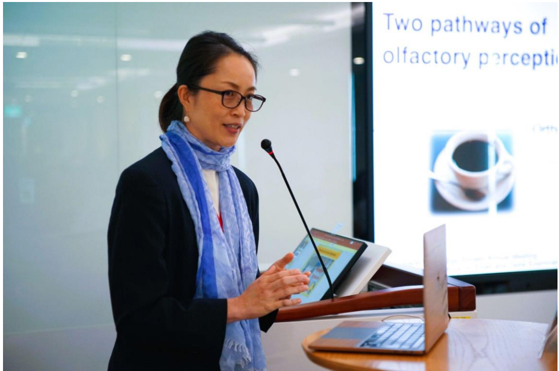
(圖)來自日本東京慈惠會醫科大學附屬醫院 - 森 惠莉 (Eri Mori)醫師演說，分享日本嗅覺領域發展與治療((Japanese olfactory test)，深入淺出，廣受好評。