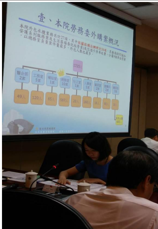
專題報告-政風室報告