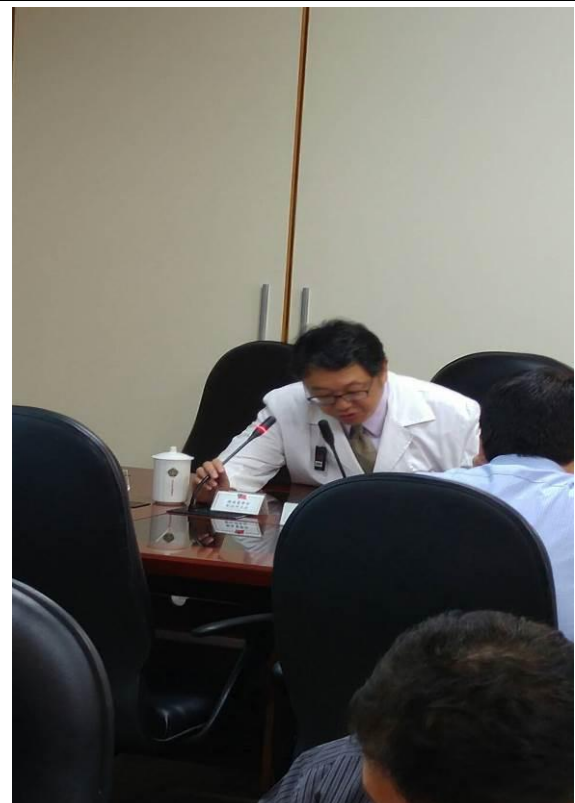
提案討論-腫瘤醫學部報告