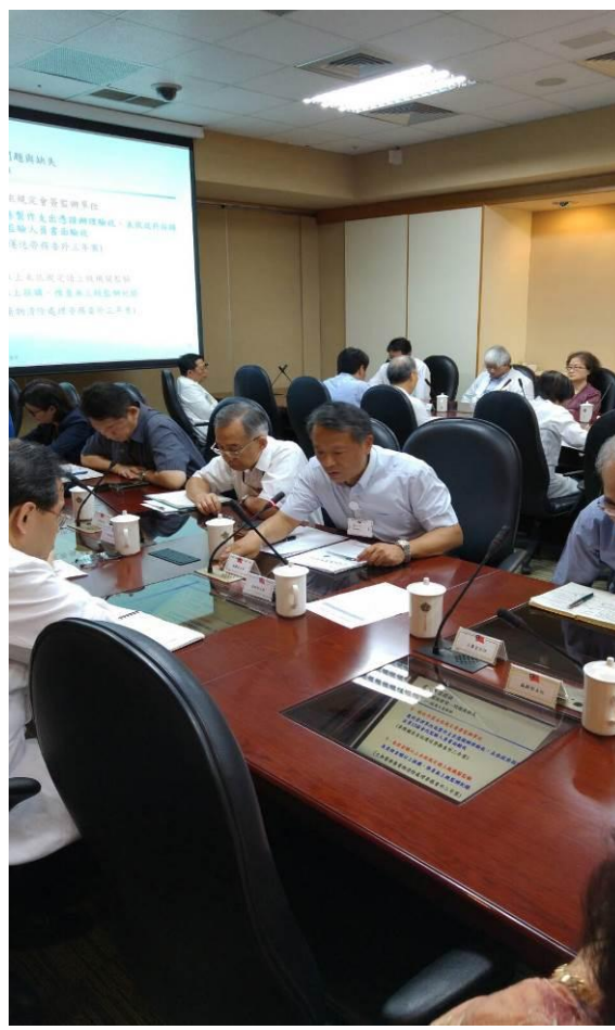
提案討論-總務室報告