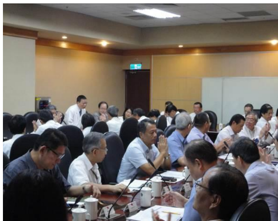
主席介紹本院新任委員