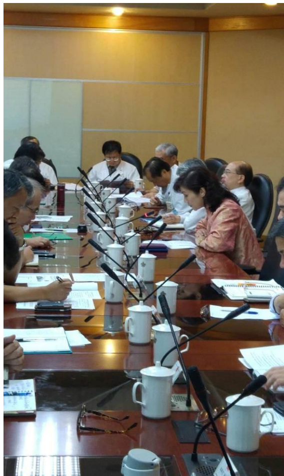
提案討論-醫務企管部報告